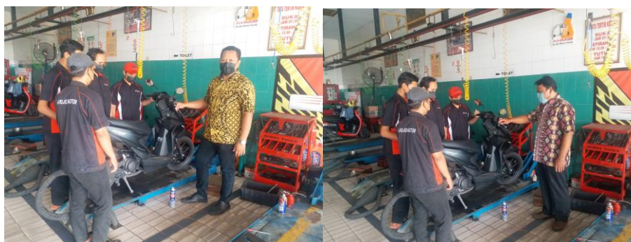
Gambar 1 Penyuluhan terhadap civitas bengkel

Kegiatan ini bermaksud untuk melaksanakan pengabdian kepada masyarakat dengan memberikan pengenalan dan penyuluhan tentang pemanfaatan biofuel sebagai alternatif energi. Membantu menyampaikan atau memberikan ilmu serta wawasan kepada pelaku bengkel yaitu mekanik/teknisi. Serta memberi solusi dalam menerapkan alternatif energi biofuel terhadap kinerja kendaraan bermotor. Pengabdian masyarakat ini dilaksanakan tanggal 20-21 Agustus 2022 di bengkel Hardjo-Motor Jl. Alas Malang No.14, Bringin, Kec. Sambikerep, Kota Surabaya, Jawa Timur 60218. Penyuluhan tersebut diikuti 8 peserta (1 supervisor dan 7 mekanik/operator).