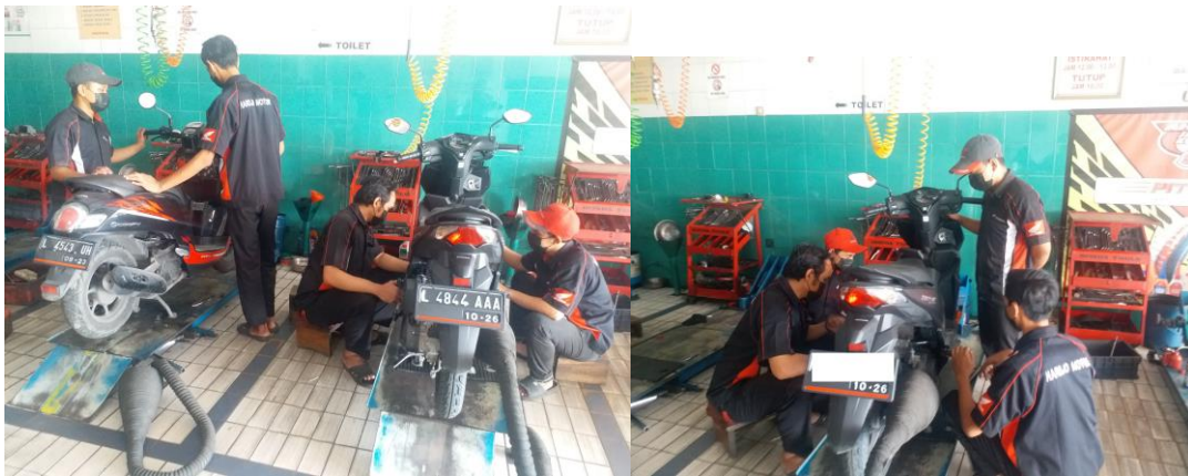
Gambar 2 Peralatan dan uji performa mesin matic

mesin matic menggunakan dynotest-chassis tipe 50L dengan putaran mesin 4000 sampai dengan 9000 rpm.