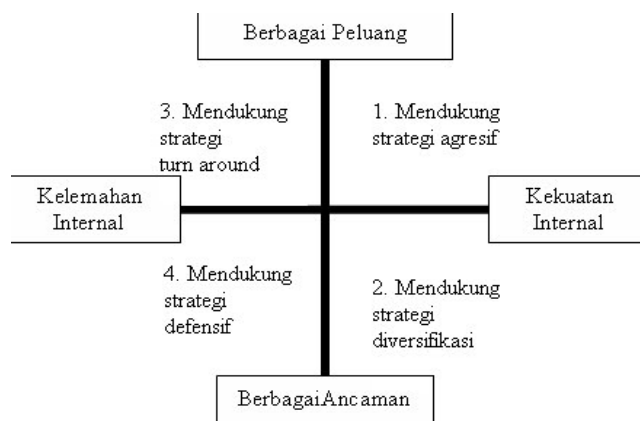
Gambar 1. Diagram Analisis SWOT

Berikut adalah kuadran pada diagram analisis SWOT: