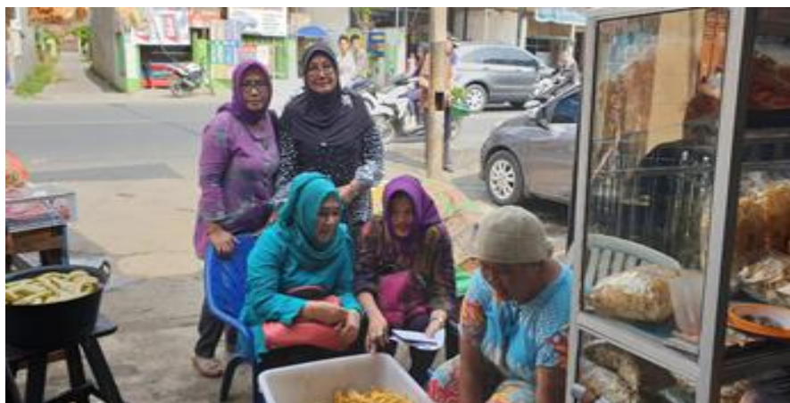
Gambar 2. Tim Pengabdian dan Mitra Usaha