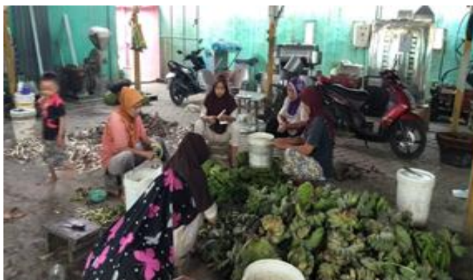
Gambar 2. Solusi Pemasaran dalam Pembuatan Packing

dalam memasarkan produknya. Peralatan yang diberikan diharapkan dapat menunjang tercapainya target ini sejalan dengan penelitian [7], [8].