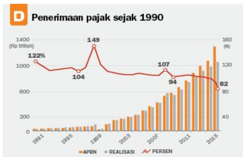
Gambar 1. Grafik Persentase Penerimaan Pajak

Pajak bagi pemerintah tidak hanya merupakan sumber pendapatan, tetapi merupakan salah satu alat kebijakan untuk mengatur jalannya perekonomian seperti terlihat pada grafik persentase penerimaan pajak di bawah ini [1].