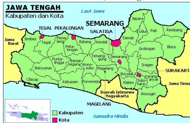
Gambar 8. Peta Jawa Tengah

Agama atau kepercayaan dapat memberikan ‘perlindungan’ atau rasa aman, terutama bagi mereka yang merantau. Pada umumnya orang Tionghoa di perantauan ‘membawa’ dewa-dewi mereka. Misalnya, dewa yang bersifat profesi dalam wujud Lu Ban. Ada juga dewa komunitas. Misalnya, Kaizhang Shengwang. Ada juga dewa umum. Misalnya, GuanGong. Selain itu ada dewa agama institutional, seperti Guan Yin, Buddha, Taishang Laojun, dan lain-lain. Apotheosis atau mengangkat seseorang menjadi suci, terutama bagi mereka yang menjadi pahlawan atau juga hidup tragis merupakan hal yang umum dalam budaya Tionghoa. Tujuannya beragam. Salah satunya adalah dengan membangun altar, mereka membangun ajaran (設壇設教).