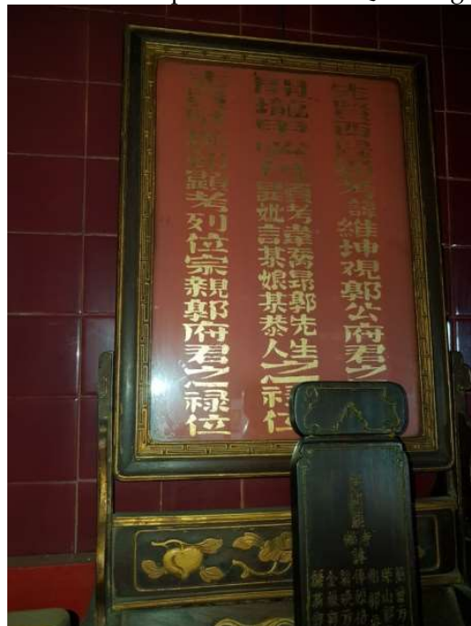
Gambar 5. Papan Arwan Gou Qiao Ang

Gelar zhenren (真人) atau 'manusia sejati' digunakan untuk tingkat pencerahan seorang umat atau praktisi agama Tao. 'zhenren' adalah orang yang memupuk sifat baik dan mendapat pencerahan ('真人'是存養本, 悟得大道之人). Menurut Zhang Xingfa, zhenren adalah orang yang sudah memahami kehidupan dan kematian sehingga tidak takut menghadapi kematian xxxi . 'Zehai' (澤海) mengandung makna 'kebajikan seluas samudra'. Kata itu juga dapat dimaknai berdasarkan zhouyi atau book of changes (周易). Makna ze (澤) dalam kitab Zhouyi dapat lebih bermakna sebagai 'peran' Zehai zhenren . Dalam konteks itu kata ze adalah dui (兌) yang masuk di gua ke-58 di mana ditulis dui wei ze (兌為澤). Di sini makna dui adalah ze . Artinya, kegembiraan, ketulusan, menjaga kebenaran, atau yang dapat membawa kebahagiaan sehingga menjadi pemimpin xxxii .