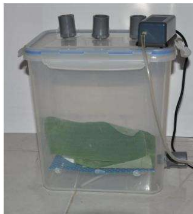
Gambar 2. Alat Fermentasi

Keterangan: AB = 27 cm BC = 22 cm CE = 5 cm EF = 21 cm DA = 26 cm G = H = I = 2 cm