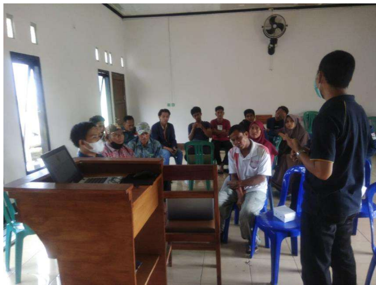
Gambar 5. Diskusi dan tanya jawab

Pada Gambar 4 terlihat Tim Penyuluh sedang memberikan materi tentang bangunan sederhana tahan gempa dari beton bertulang. Dalam materi ini dijelaskan mulai dari pemilihan lokasi rumah, pemilihan bentuk rumah, dan persyaratan komponen bahan bangunan. Selanjutnya menjelaskan bagaimana tata cara membuat tulangan baja untuk struktur beton bertulang, pemasangannya, dan pengecoran beton pada begisting yang sudah disiapkan. Pada sesi ini juga disampaikan bagaimana cara memanfaatkan sumber daya alam yang berada disekitar kita yaitu tanaman bambu. Dalam hal ini bambu akan dimanfaatkan untuk membuat rumah tahan gempa dengan konsep rumah bambu plester. Konsep rumah bambu plester yaitu memanfaatkan bilah bambu untuk komponen balok, kolom, dan dinding yang dicor beton kemudian difinishing menggunakan plesteran dari mortar. Pada rumah model