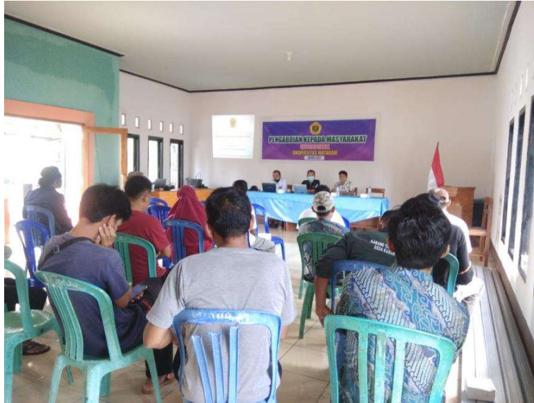
Gambar 4. Penyampaian materi penyuluhan