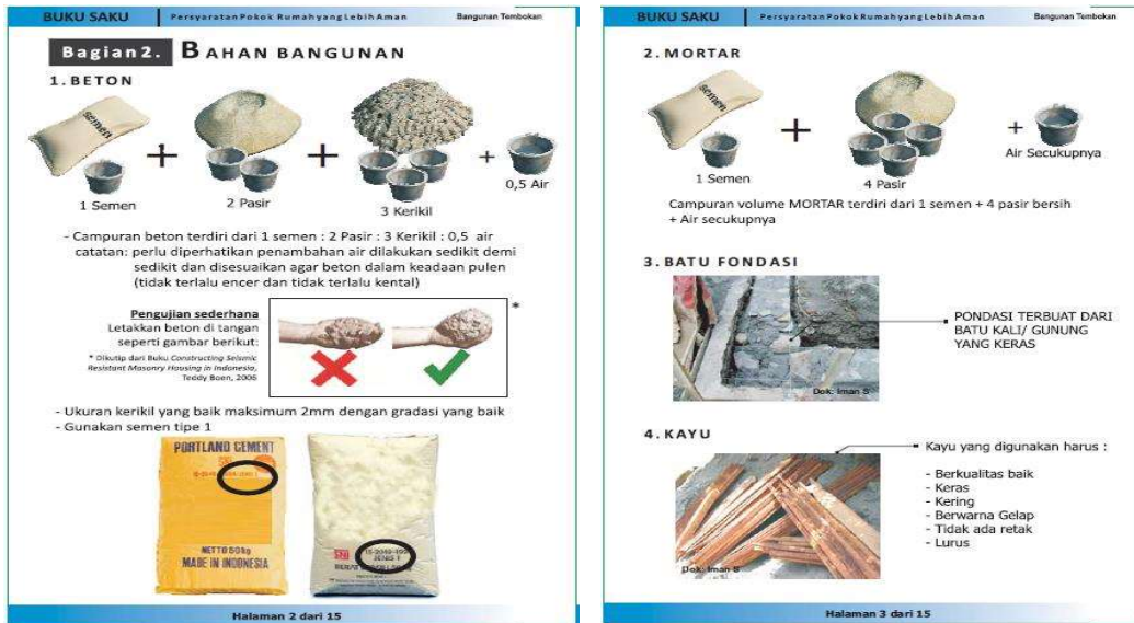
Gambar 1. Perbandingan isi campuran beton Gambar 2. Kualitas mortar, pondasi, kayu

meliputi: kualitas bahan beton, mortar, pondasi, dan kayu. Gambar 1 berikut menunjukkan perbandingan isi campuran beton sedangkan Gambar 2 menunjukkan kualitas mortar, pondasi, dan kayu.