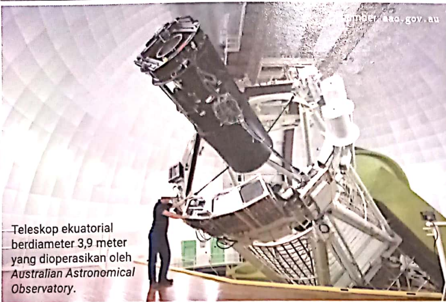
Teleskop ekuatorial berdiameter 3,9 meter yang dioperasikan oleh Australian Astronomical Observatory.