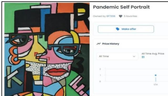
Gambar 2. Lukisan karya Gubernur Jawa Barat Ridwan Kamil pada platform OpenSea

NFT juga bisa dalam bentuk karya seni berupa lukisan. Seperti lukisan karya Gubernur Jawa Barat Ridwan Kamil yang berhasil menjual karyanya lewat platform NFT.