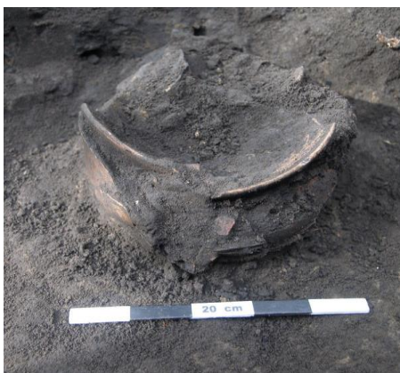
Foto 1: Temuan konsentrasi wadah tembikar dari Sektor KBU 2 TP 1.

Hasil ekskavasi di situs Tanjung Uringin secara umum berhasil mendapatkan sejumlah data arkeologi terutama fragmen keramik dan tembikar kecuali di sektor KBU 3 yang sama sekali tidak ada indikasi temuan arkeologi. Lapisan tanah pada bagian permukaan sudah terganggu dan baru pada kedalaman antara 30-40 cm lapisan tanah dapat dikatakan belum terganggu. Temuan arkeologi paling banyak berada pada lapisan tanah lempung berwarna kekuningan. Selain fragmen keramik dan tembikar ditemukan pula fragmen besi dan sisa arang serta sejumlah fitur sisa tiang di KBU 1.