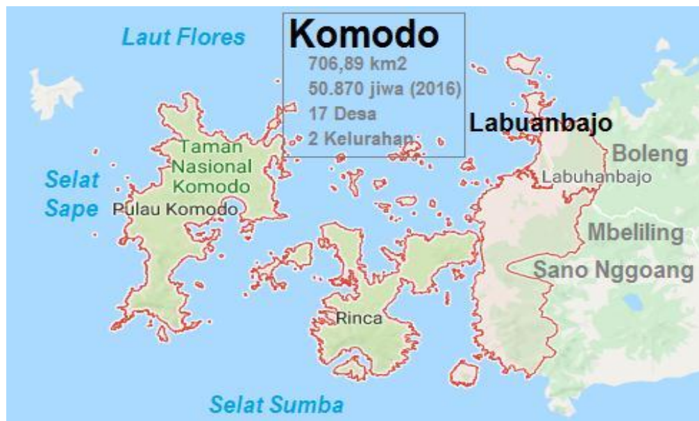
Gambar 1 Lokasi Pengabdian Masyarakat (Labuan Bajo Kabupaten Manggarai Barat)

Poltekkes Kemenkes Kupang mempunyai status BLU. Sehingga hal ini juga berdampak pada upaya untuk meningkatkan jumlah pendapatan institusi, yang mana salah satunya adalah melalui biaya kuliah. Untuk itu dibutuhkan jumlah animo pendaftar dan juga jumlah mahasiswa yang cukup untuk pelaksanaan operasional BLU, ditunjang dengan pendapatan BLU lainnya. Untuk itu Tim melakukan kegiatan pengabdian masyarakat melalui promosi institusi di Labuan Bajo Kabupaten Manggarai Barat. Kabupaten Manggarai Barat merupakan hasil Pemekaran wilayah administratif Kabupaten Manggarai, melalui UU RI NO. 8 Tahun 2003.