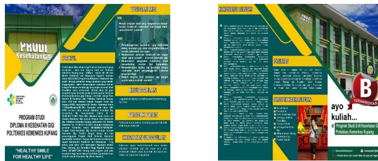
Gambar 10 Brosur Prodi Keperawatan Gigi