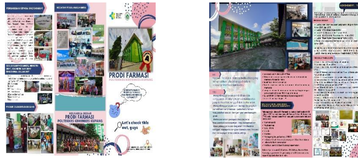
Gambar 9 Brosur Prodi Farmasi