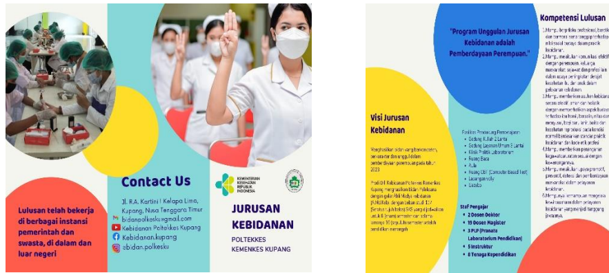
Gambar 3 Brosur Prodi D III Kebidanan