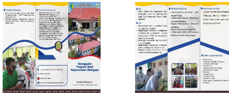
Gambar 11 Brosur Prodi Keperawatan Waingapu