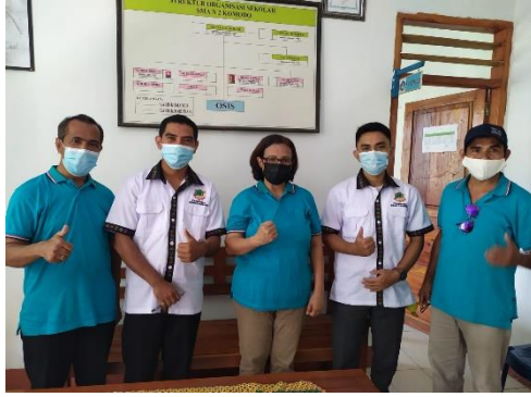
Gambar 15 Promosi di SMAN 2 Komodo