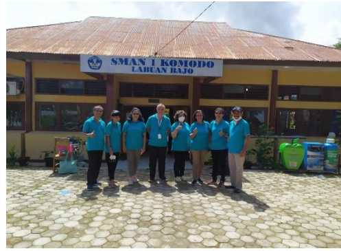
Gambar 16 Promosi di SMAN 1 Komodo