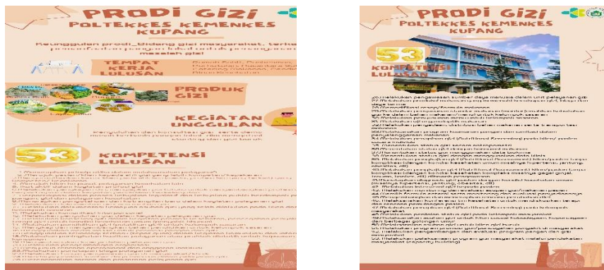
Gambar 4 Brosur Prodi Gizi