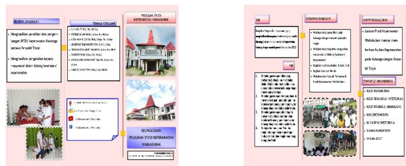
Gambar 12 Brosur Prodi Keperawatan Waikabubak