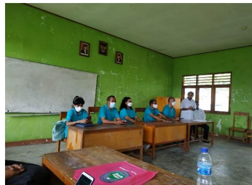
Gambar 17 Promosi di SMAN 3 Komodo

Fungsi pendidikan salah satunya adalah sosialisasi. Sosialisasi merupakan proses perkembangan individu menjadi makhluk sosial yang mampu beradaptasi dengan masyarakat. Selain itu memperkenalkan sebuah sistem pada seseorang dan bagaimana orang tersebut menentukan tanggapan serta reaksinya. Faktor yang mempengaruhi sosialisasi yaitu lingkungan sosial, ekonomi dan kebudayaan dimana individu berada, selain itu ditentukan oleh interaksi pengalaman-pengalaman serta kepribadiannya. Bagi individu, sosialisasi berfungsi sebagai pedoman dalam belajar mengenal dan menyesuaikan diri dengan lingkungannya, baik nilai, norma, dan struktur sosial yang ada pada masyarakat di lingkungan tersebut.