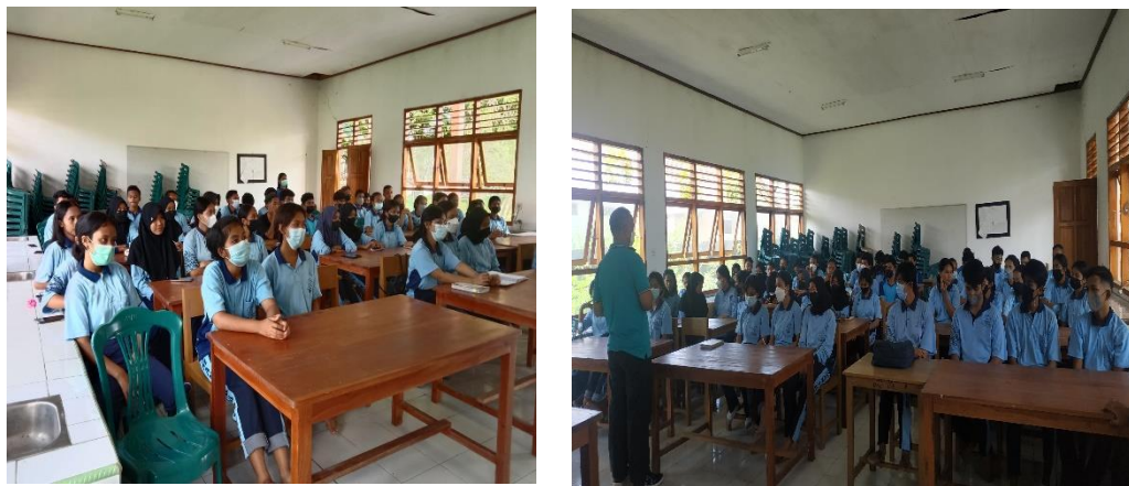
Gambar 14 Promosi di SMAN 1 Komodo

Tim pengabdian masyarakat masing-masing mewakili dari setiap program studi yaitu Kebidanan 1 orang, Keperawatan 4 orang, Gizi 1 orang, TLM 1 orang, Farmasi 1 orang, Keperawatan Gigi 1 orang. Pada saat kegiatan promosi, tim menyampaikan tentang visi, misi, tujuan, akreditasi, keunggulan, kompetensi lulusan, SDM, fasilitas pembelajaran (teori dan praktek), sarana prasarana dari setiap program studi.