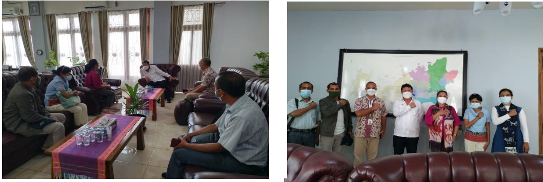
Gambar 13 Pendekatan Dan Pertemuan Dengan Bupati Manggarai Timur

Pengabdian masyarakat dilaksanakan di Labuan Bajo, Kabupaten Manggarai Barat mulai tanggal 8 sampai 9 Desember 2020, bertempat di 3 (tiga) SMA. Kegiatan diawali dengan pertemuan bersama Bupati Kabupaten Manggarai untuk permohonan ijin dan menyampaikan terkait tujuan dari kegiatan sosialisasi pengembangan pendidikan di Poltekkes Kemenkes Kupang.