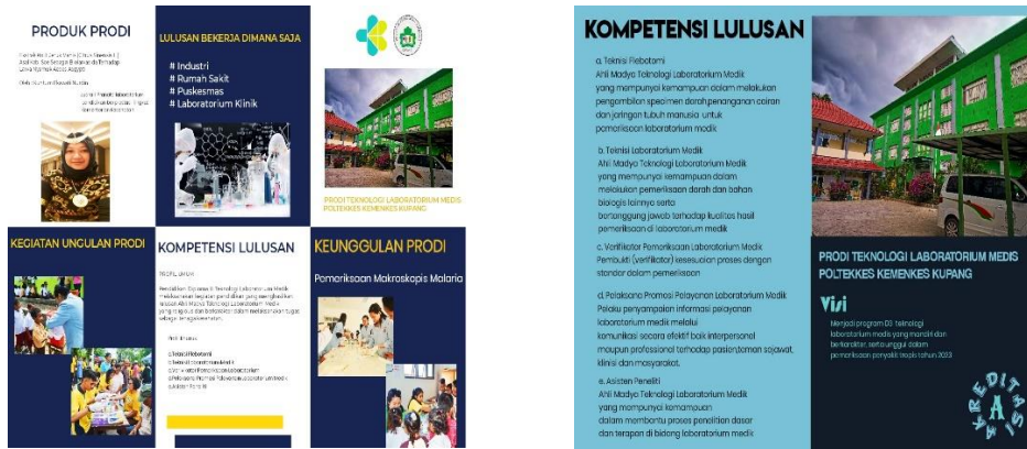
Gambar 5 Brosur Prodi Teknologi Laboratorium Medis (TLM)