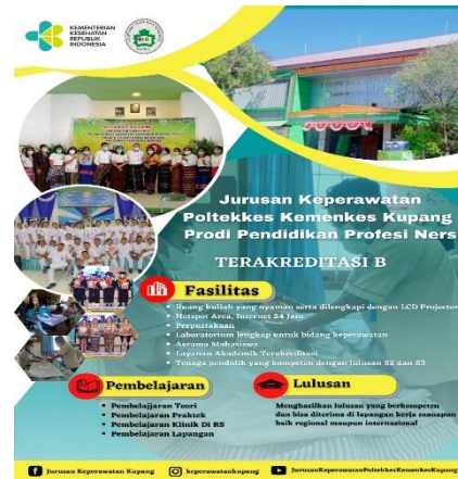
Gambar 6 Brosur Prodi D III Keperawatan & Prodi Pendidikan Profesi Ners