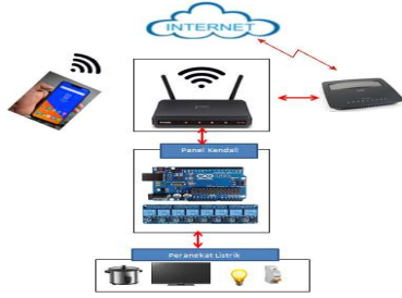
Gambar 6. Pengendalian Dengan Menggunakan Jaringan internet

Pada gambar diatas merupakan pengembangan dari koneksi local, agar pengguna dapat mengendalikan perangkat listrik (TV, Rice Cooker, Reservoar, Lampu listrik dan Pengaman Listrik) memalui koneksi internet. Pada gambar 6, terdapat modem/router yang berfungsi sebagai media penghubung koneksi local dan internet. Agar pengguna dapat memonitoring dan mengendalikan perangkat alat listriknya maka pengguna harus terkoneksi dengan internet, setelah terkoneksi dengan internet maka pengguna dapat mengakses alamat “ http://www.penelitian-kendali-gedyus.com ” pada smart phone pengguna, selanjutnya akan tampil halaman website pada smart phone pengguna yang digunakan sebagai remote untuk mengirim instruksi ke relay arduino yang fungsinya untuk mengendalikan perangkat peralatan listrik pada suatu rumah.