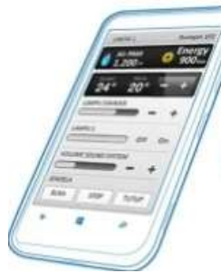
Gambar 3. Smartphone

Aplikasi ini seperti program yang ada di desktop komputer, namun tidak rumit dan dapat dibawa kemana-mana. Smartphone diciptakan untuk menyediakan berbagai aplikasi yang dapat di download dari internet dengan menggunakan sebuah operating system (OS) spesifik seperti Apple dengan iOS, Google Android, Microsoft Windows Mobile dan Windows Phone, Nokia Symbian, RIM Black Berry OS dan lain-lain