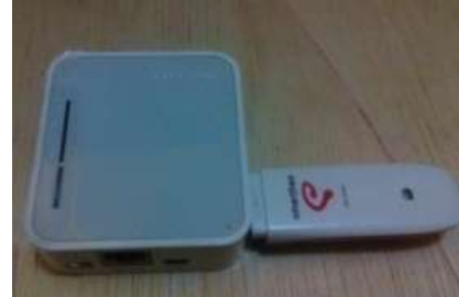
Gambar 4. Modem Router

Router adalah salah satu perangkat keras jaringan komputer yang digunakan untuk membagi protocol kepada anggota jaringan yang lainnya. Fungsi router pada umumnya adalah sebagai penghubung antar dua atau lebih jaringan untuk meneruskan data dari satu jaringan ke jaringan lainnya. Namun router berbeda dengan Switch, karena Switch hanya digunakan untuk menghubungkan beberapa komputer dan membentuk LAN (local area network). Sedangkan router digunakan untuk menghubungkan antar satu LAN dengan LAN yang lainnya.