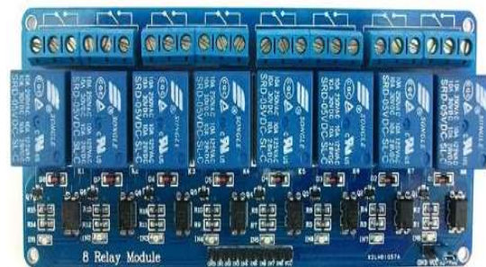
Gambar 2. Relay

Relay juga banyak digunakan untuk pengontrolan mesin-mesin yang bekerja secara sekuensial sebelum teknologi mikroprosesor tersedia, misalnya pada mesin injection molding, blow molding, dan pada conveyor belt.