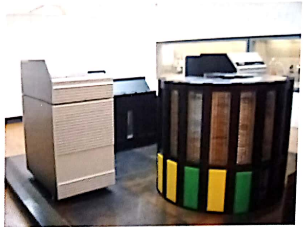
Gambar 2-1: Gambar super komputer (cray-2) sebagai komputer tercepat di dunia pada tahun 1985 -1989

dibandingkan dengan komputer biasa/ komputer pribadi.