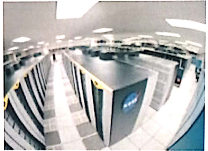
Gambar 3-2: Cluster komputer yang digunakan oleh NASA