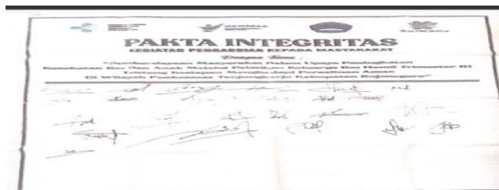
Gambar 3. Fakta Integritas

Pelatihan ini menghasilkan Komitmen Bersama Dalam Mendukung Mensukseskan Kegiatan Pelatihan Keluarga Ibu Hamil Trimster III tentang Kesiapan Menghadapi Persalinan Aman di wilayah Puskesmas Tanjungharjo Kabupaten Bojonegoro 28-30 Juni 2022. Komitmen bersama ini ditandatangani oleh seluruh peserta pelatihan yang terdiri 30 Keluarga Ibu Hamil TS III (Suami dari Ibu Hamil TS III) Puskesmas Tanjungharjo.