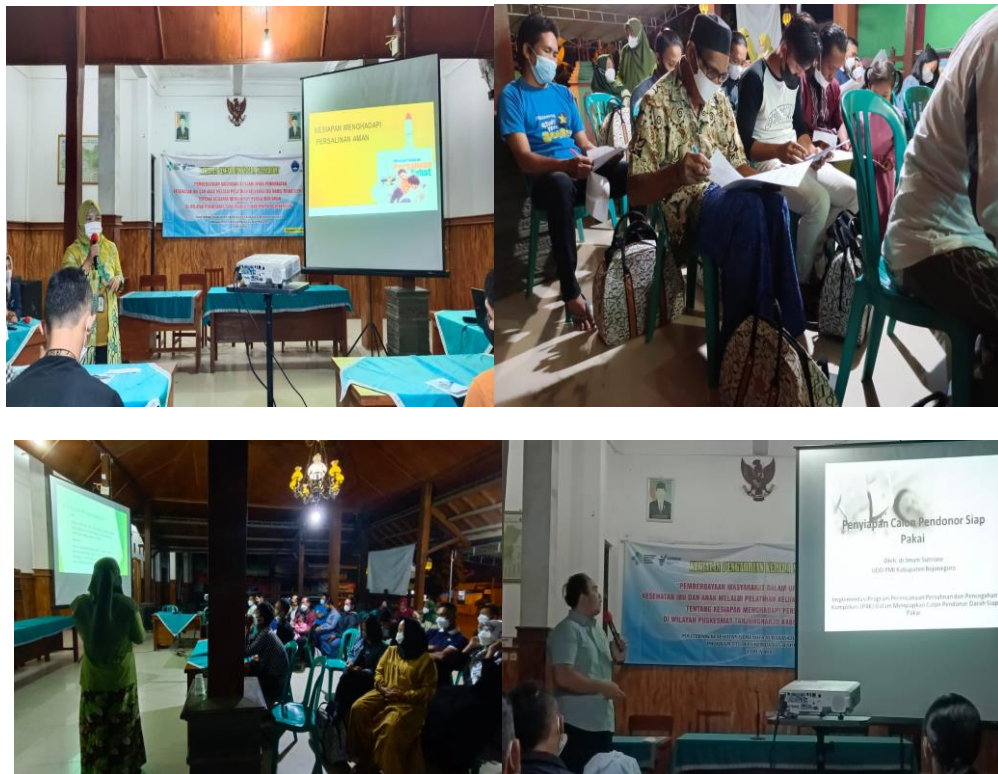
Gambar 2. Pelaksanaan Kegiatan