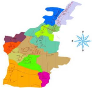
Gambar 1 Peta Lokasi Wilayah Kerja Puskesmas Tanjung Harjo Kegiatan Pengabdian Kepada Masyarakat