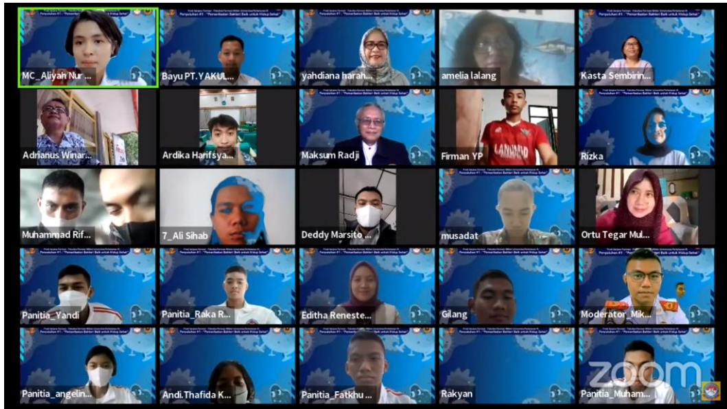
Gambar 2. Kondisi peserta saat penyuluhan daring