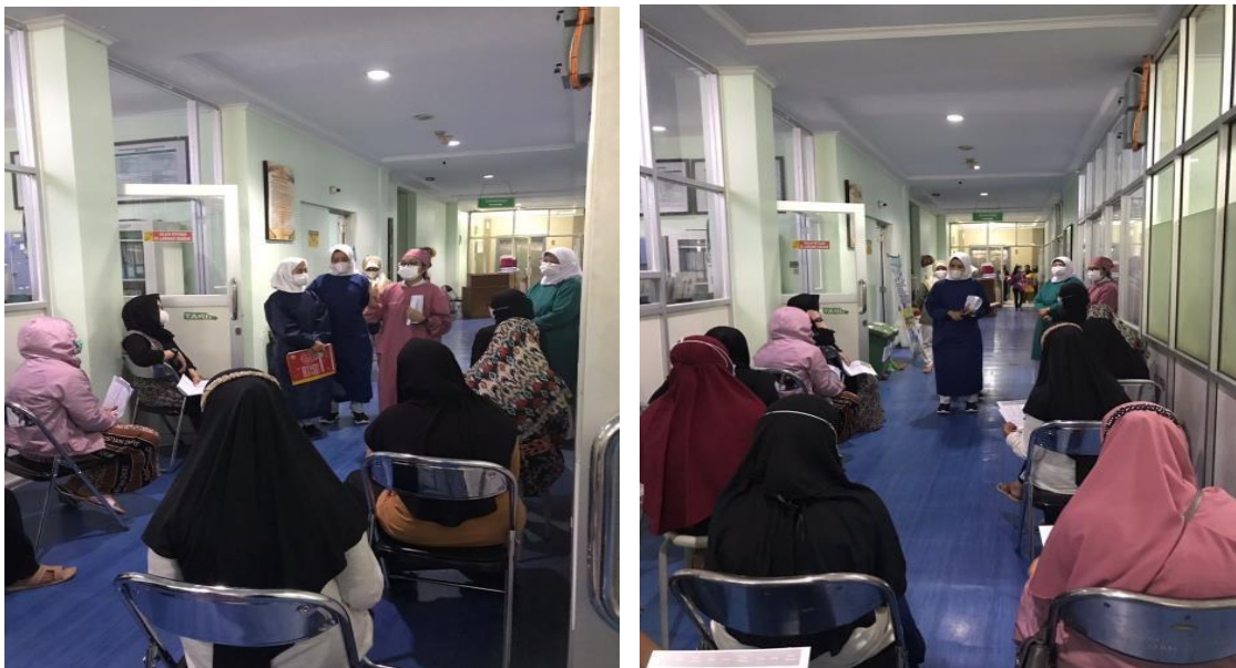
Gambar 1 Kegiatan Pendidikan Kesehatan mengenai Diet TKTP

Topik kegiatan pendidikan kesehatan yang dilakukan adalah Nutrisi untuk mendukung penyembuhan luka pasca operasi, dengan Subtopik kebutuhan nutrisi pasca operasi. Sasaran dari kegiatan pendidikan kesehatan yang dilakukan adalah pasien pasca operasi dan keluarga. Pendidikan kesehatan dilakukan pada hari Selasa, 27 September 2022, pukul 11.00 sampai dengan selesai. bertempat di ruang Jasmine di RSUD Sumedang.