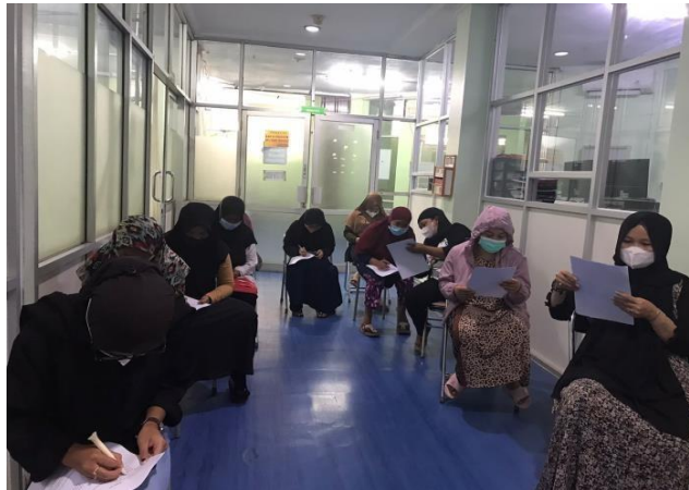
Gambar 2 Kegiatan Evaluasi Pretest dan Posttest

Hasil yang didapatkan dari nilai pretest penyuluhan ( N = 13 ) yaitu nilai tertinggi 80, nilai terendah 50 dengan nilai rata-rata 65,8. Hasil yang didapatkan nilai posttest penyuluhan ( N = 13 ) yaitu nilai tertinggi 100, nilai terendah 60 dengan nilai rata-rata 77. Hasil diskusi yang dilakukan selama kegiatan pendidikan kesehatan didapatkan 13 dari 14 peserta mampu mengikuti kegiatan penyuluhan, 13 peserta mengikuti kegiatan penyuluhan dengan aktif, 13 peserta mengikuti kegiatan penyuluhan dari awal hingga akhir, dan terjadi kenaikan nilai rata-rata dari pretest ke posttest. Namun, saat diberikan waktu untuk tanya jawab, tidak ada peserta yang mengajukan pertanyaan. Dikarenakan peserta sudah mengerti mengenai materi pendidikan kesehatan yang sudah disampaikan. Hasil evaluasi dari pelaksana penyuluhan bagi tiap anggota kelompok, ada beberapa hal yang perlu dipertahankan yaitu menguasai materi dan mampu menjawab setiap pertanyaan yang diajukan oleh peserta, mampu mempertahankan kontak mata dan menggunakan bahasa yang sopan dan mudah dimengerti oleh peserta dalam menyampaikan materi yang dibawakan, dan mampu menguasai kondisi dan suasana saat penyuluhan dilakukan. Namun ada hal hal yang perlu diingatkan atau diperbaiki yaitu memperhatikan intonasi ketika memberikan penyuluhan kepada peserta, memberikan motivasi kepada peserta untuk mengimplementasikan terkait materi penyuluhan pada kehidupan sehari-hari.