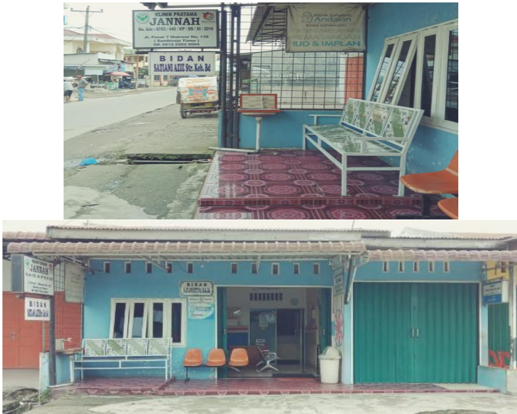
Gambar 1: Lokasi Pengabdian Masyarakat