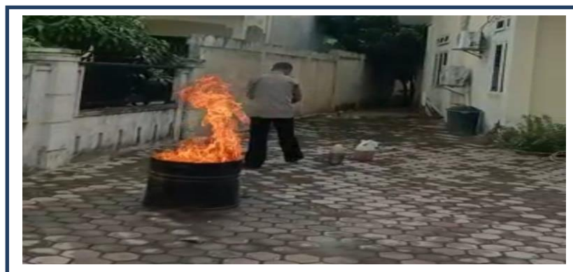
Gambar 3 : Simulasi Mitigasi Bencana