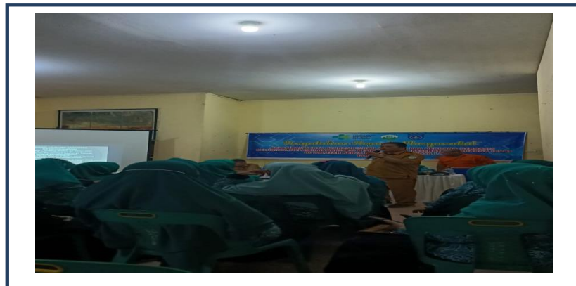
Gambar 2 : Pemberian Materi dari Sekretaris BPBD Kota Langsa