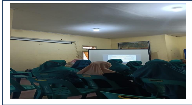
Gambar 1 : Penyuluhan Mitigasi Bencana Pada Organisasi PKK

masalah tersebut. Namun tidak menutup kemungkinan kondisi kegawatdaruratan dapat terjadi pada daerah yang sulit dijangkau oleh petugas kesehatan. Sehingga pada kondisi tersebut peran serta masyarakat khususnya kader kesehatan untuk membantu korban sebelum ditangani oleh petugas kesehatan ahli menjadi sangat penting (Griffthi, 2019).