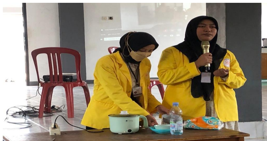
Gambar 3. Pelaksanaan Demonstrasi MPASI