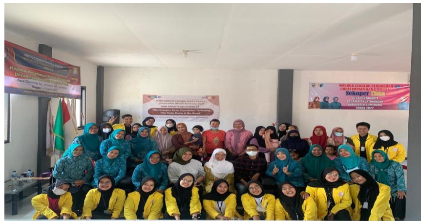
Gambar 4. Foto kegiatan