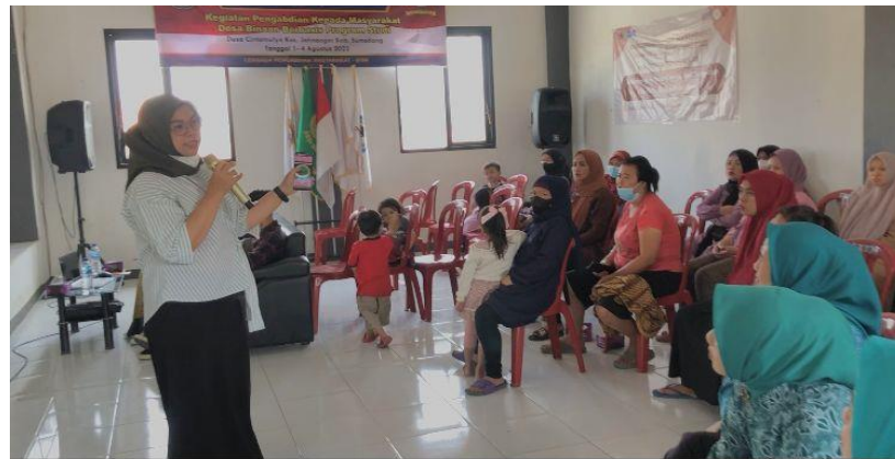
Gambar 2. Penyampaian Materi