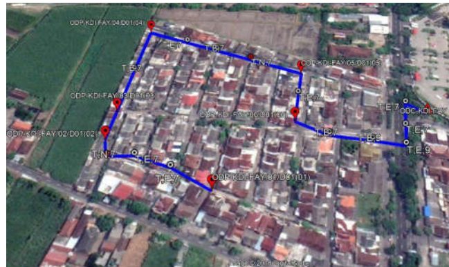
Gambar 3. Gambar Pembangunan Jaringan Fiber Optik

Dalam melakukan analisa perhitungan loss link budget menggunakan rumus seperti berikut :