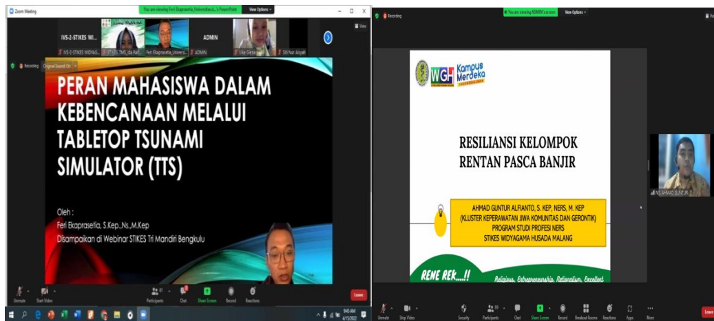
Gambar 2. Foto Dokumentasi Kegiatan Webinar

Pada kegiatan ini peserta yang hadir didalam wibenaar sekitar 250 orang peserta. Peserta dalam zoominar memberikan respon yang baik selama kegiatan berlangsung. Mereka sangat antusias ada beberapa peserta yang bertanya kepada pemateri mengenai bagaiman dalam menghadapi ketika terjadi bencana.