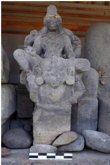
Gambar 3. Arca Wisnu di Pura Gelang Agung

Arca Dewa Wisnu di Pura Gelang Agung, Dusun Buangga, Petang-Badung AW2) Arca Dewa Wisnu ini telah diinventaris oleh Balai Pelestarian Cagar Budaya Bali dengan nomor inventaris 1/14-03/BB/15. Secara keseluruhan arca ini memiliki tinggi 110 cm, lebar 37 cm, tebal 50 cm (gambar 3). Terbuat dari bahan batu padas pada beberapa bagian mengalami keausan. Arca digambarkan duduk ( asana murti ) di atas wahana berupa burung garuda, dengan kepala yang ditegakkan dengan pandangan lurus kedepan. Arca Wisnu digambarkan dalam sikap duduk pralambha