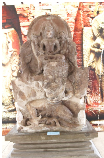
Gambar 7. Arca Wisnu di PIM, Trowulan Jawa Timur

AW2 dan AW3 dapat dibandingkan dengan Arca Wisnu yang ditemukan di Candi Belahan yang sekarang tersimpan di Pusat Informasi Majapahit, Trowulan, Jawa Timur. Arca ini dikatakan sebagai perwujudan raja Airlangga, diperkirakan arca ini berasal dari abad X-XI Masehi (Krom dalam Fauzi 2000, 59). AW2 dan AW3 memiliki beberapa persamaan dengan Arca Wisnu perwujudan Airlangga seperti menunggangi burung garuda sebagai wahananya, sikap duduk, mahkota, sikap tangan sehingga dapat diperkirakan bahwa AW2 dan AW3 berasal dari abad X-XII Masehi. Pendapat ini senada dengan pendapat yang disampaikan Suantika (2013: 50), bahwa AW2 berasal dari abad X-XII Masehi sesuai dengan langgam arca-arca dari periode Bali Kuno (X-XIII Masehi).