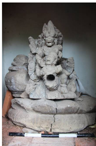
Gambar 5. Arca Narasimha di Pura Bajra Narasingha Murti.

Tampaksiring-Gianyar (AW4) Arca Dewa Wisnu ini telah di inventaris oleh Balai Pelestarian Cagar Budaya Bali dengan nomor inventaris 1/14-04/BND/1986. Arca Dewa Wisnu ini berwujud Narasimha awatara. Narasimha merupakan perwujudan Dewa Wisnu dalam bentuk manusia berkepala singa untuk mengalahkan Hiranyakasipu. Secara keseluruhan arca ini memiliki ukuran tinggi 51 cm, lebar 32 cm, tebal 60 cm (gambar 5).