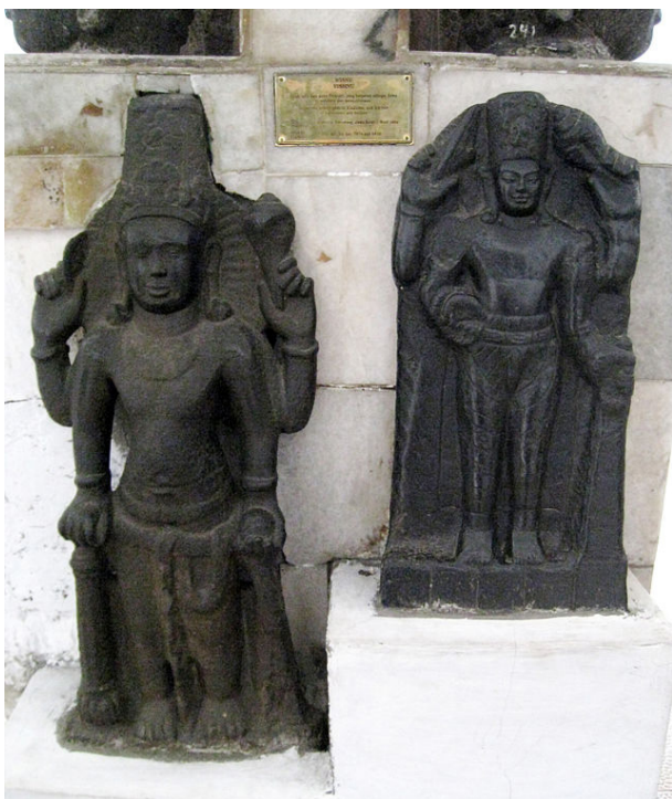
Gambar 6. Arca Wisnu Cibuaya I dan II.

Tinggalan arca-arca dewa Wisnu di Bali tidak menyajikan data tertulis yang dapat dipakai menetapkan kronologinya. Keadaan ini menimbulkan kesulitan dalam menentukan umur terhadap tinggalan arca tersebut. Untuk itu dilakukan studi perbandingan guna mengetahui periodisasi arca-arca Dewa Wisnu tersebut. Perbandingan ini didasari oleh prinsip umum, yaitu persamaan langgam mengacu kesamaan periodisasi. Periodisasi arca-arca Wisnu di Bali, selain menggunakan acuan dari penelitian Stutterheim dilakukan pula perbandingan dengan arca-arca Wisnu yang ditemukan di luar Bali terutama Jawa. AW1 dapat dibandingkan dengan arca Wisnu yang ditemukan di di Desa Cibuaya, Kecamatan Cibuaya, Kabupaten Karawang, Provinsi Jawa Barat (gambar 6). Hal tersebut didasarkan pada kesamaan bentuk, laksana yang dibawa serta sikap arca yang sama.