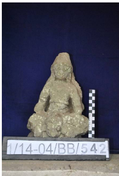
Gambar 4. Arca Wisnu di Pura Samuan Tiga (AW3).

Arca Dewa Wisnu di Pura Samuan Tiga, Desa Bedulu, Blahbatuh-Gianyar (AW3) Arca Dewa Wisnu ini telah diinventaris oleh Balai Pelestarian Cagar Budaya Bali dengan nomor inventaris 1/14-04/BB/542. Tempat tersimpannya yaitu di Pelinggih Batara Gana . Secara keseluruhan arca ini memiliki ukuran tinggi 32 cm, lebar 17 cm, dan tebal 13 cm (gambar 4). Sebagian besar arca dalam