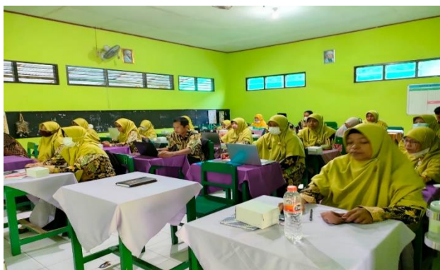
Gambar 3. Suasana Pelaksanaan Workshop Penulisan Tulisan Ilmiah

Berdasarkan proses pengabdian dan pelatihan penulisan karya tulis ilmiah yang diikuti oleh 55 orang guru Kementerian Agama di Kabupaten Karanganyar, dapat disimpulkan bahwa kegiatan penulisan artikel ilmiah yang dilakukan oleh seorang guru profesional sangat diperlukan. Hal ini didasari oleh pendapat Mansyur & Akidah (2018) yang beranggapan bahwa setiap guru harus selalu belajar tentang cara menjadi guru yang profesional dan mempunyai kemampuan yang mumpuni. Seperti yang telah diketahui bahwa tugas guru bukan hanya seputar mengajar di kelas atau membimbing siswa dalam belajar.