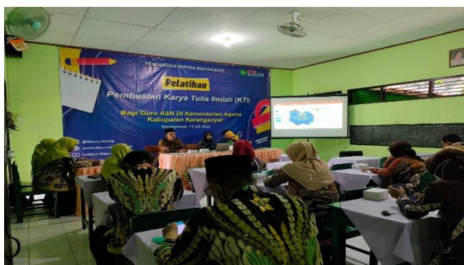
Gambar 5. Suasana Pelaksanaan Workshop Penulisan Tulisan Ilmiah

Pada dasarnya, kegiatan pelatihan ini dapat memberikan manfaat yang signifikan untuk para guru khususnya di lingkungan Madrasah Ibtidaiyah Negeri dan Madrasah Ibtidaiyah Muhammadiyah Kabupaten Karanganyar. Para guru sebagai peserta pelatihan mampu untuk mengikuti alur pelatihan dan terlihat antusias dengan cara mengajukan pertanyaan. Hal serupa juga terjadi pada artikel pelatihan penulisan karya tulis ilmiah yang disusun oleh Mansyur & Akidah (2018) yang menyatakan bahwa para peserta mampu untuk menciptakan karya ilmiah yang mumpuni untuk dibuat buku atau dikirim ke rumah jurnal dan media cetak. Berikut adalah gambaran lain dari kegiatan pelatihan.