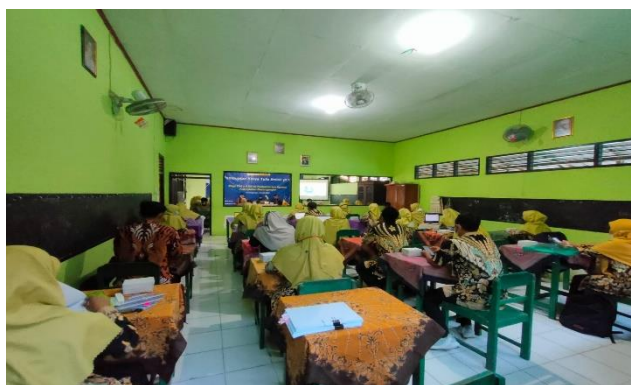
Gambar 4. Suasana Pelaksanaan Workshop Penulisan Tulisan Ilmiah

Seperti yang dapat dilihat pada gambar 4, proses kegiatan pelatihan untuk menyusun karya tulis ilmiah berjalan lancar serta tertib. Semua peserta terlihat antusias dan sangat memperhatikan para pemateri dalam menerangkan materi. Terdapat banyak peserta yang juga menunjukkan respon dengan mengajukan beberapa pertanyaan kepada pemateri sehubungan dengan materi yang dibahas. Lebih jauh lagi, pada sesi pembuatan karya ilmiah yang berlangsung selama 45 menit, tercatat ada sekitar 20 peserta yang telah membuat kerangka karya ilmiahnya dengan baik sehingga selanjutnya dapat melakukan penelitian yang lebih mendalam.