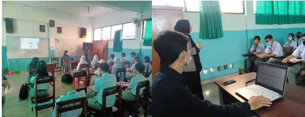
Gambar 4. Kegiatan Sosialisasi Digital Entrepreneurship

kontennya sehingga perlu adanya pendalaman terkait alur narasi konten yang akan disajikan kepada konsumen. Dengan demikian, konsistensi proses pembuatan konten dapat terjamin dan berjalan secara berkelanjutan dalam jangka panjang. Selain itu, terdapat alternatif lain dalam pembuatan konten yaitu dengan menggunakan jasa pihak ketiga (pihak eksternal) yang ahli untuk menggarap pembuatan konten yang digagas perusahaan atau pelaku bisnis agar lebih menarik.