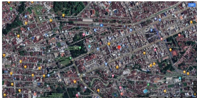
Gambar 1. Peta Lokasi SMA Swasta Sultan Agung

memiliki kualitas yang baik dan sekaligus juga inovatif, sehingga memiliki ciri khas tersendiri untuk bersaing di pangsa pasar. Dengan adanya peningkatan keterampilan dan pengetahuan pada aspek strategi pemasaran serta penggunaan media pemasaran, diharapkan mampu memberikan peningkatan yang signifikan. Jarak ke lokasi mitra yakni dari Kampus Sekolah Tinggi Ilmu Ekonomi Sultan Agung berada pada kisaran 1,2 km atau membutuhkan waktu perjalanan sekitar 5 menit jika perjalanan ditempuh dengan menggunakan kendaraan roda empat da 3 menit jika ditempuh dengan menggunakan kendaraan roda 2