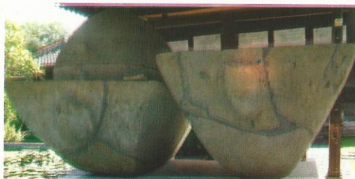
Foto no. 11. Sarkofagus ganda Sampiang, Gianyar

Sampiang, Gianyar (Bali)(Foto no. 11). Kubur ganda pada masa prasejarah dijumpai pada tinggalan pemukiman pantai di Plawangan (Jawa Tengah) dan di Gilimanuk (Bali)(Foto no. 12), yaitu pada tradisi penguburan tempayan, pada kubur batu dolmen di Sumba (NTT), kubur waruga di Sulawesi Tengah. Konsep kubur ganda ini diduga terjadi karena adanya keterkaitan antara suami istri atau raja dan permaisurinya. Kubur sarkofagus ganda di Gianyar dibuat dengan menempatkan sebuah sarkofagus di dalam sarkofagus lain yang lebih besar. Khusus dalam penguburan sarkofagus