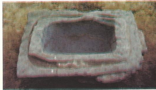
Foto no. 7. Sarkofagus ganda di subak Roban Bitera

b). Masalah kedua , mengenai temuan sarkofagus ganda, yaitu ditemukannya sarkofagus di dalam sarkofagus. Peristiwa temuan sarkofagus ganda merupakan temuan yang penting yang dapat menjadi bukti adanya perubahan pola pikir dan perubahan budaya, terutama dalam cara penguburan sarkofagus (Foto no. 7).