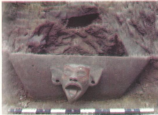
Foto no. 6. Tonjolan kedok muka dengan cat merah pada bagian wadah sarkofagus

a). Masalah pertama , adalah ditemukannya sarkofagus yang menggunakan cat warna merah pada pahatan kedok muka manusia. Penggunaan cat warna merah ini tidak biasa dipakai dalam teknologi pembuatan sarkofagus (Foto no. 6).