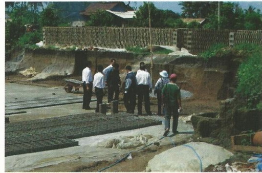
Foto no. 9. Sarkofagus ditemukan di areal pembuatan batu bata

Pencarian bahan merupakan tahap awal yang dilalui dalam pembuatan sarkofagus. Pencarian bahan bertujuan untuk memperoleh bahan baku yang berkualitas tinggi yang berorientasi pada sifat-sifat batu, antara lain kekerasan batu, kemudahan pemahatan, kemudahan pengukiran. Bahan baku erat kaitannya dengan hasil akhir dari pembuatan sarkofagus. Dengan bahan baku berkualitas tinggi akan dihasilkan pahatan sarkofagus yang sempurna. Dari hasil pengamatan penulis selama ini sarkofagus dibuat dengan bahan antara lain batuan padas, batuan andesit, dan ada juga yang digunakan bahan tanah liat yang dibakar. Sarkofagus yang dibuat dengan tanah liat yang dibakar (terakota) berhasil ditemukan oleh tim penelitian Balai Arkeologi Denpasar di pantai utara Bali, yaitu di Banjar Asem. Sarkofagus situs Roban dibuat dari sejenis batuan padas yang sangat keras yang berkualitas, sehingga pahatan yang rumit pada bagian kedok muka tidak mudah rusak. Dalam tahap pencarian bahan baku termasuk di dalamnya