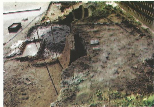
Foto no. 8. Lingkungan tempat ditemukan sarkofagus

Dalam penelitian prasejarah, keadaan lingkungan atau keadaan situs sangat penting. Lingkungan merupakan salah satu persyaratan yang harus dipenuhi pada saat nenek moyang masa