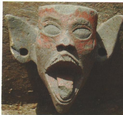
Foto no. 10. Detil tonjolan kedok muka manusia mempergunakan cat warna merah

Penggunaan cat warna pada dasarnya telah lama dikenal bahkan dapat dikatakan merupakan pengetahuan dan teknologi yang sudah berlangsung lama, yaitu sejak masa berburu dan mengumpulkan makanan tingkat lanjut (masa epipaleolitik)(Foto no. 10). Penggunaan cat pada masa berkembangnya tradisi megalitik telah diemukan bukti-buktinya pada saat penggalian dan penelitian kubur batu di dataran tinggi Pasemah (Kusumawati, 2002). Cat yang dipergunakan adalah warna merah, putih, kuning, dan hitam. Dari hasil penelitian Samidi dari Direktorat Perlindungan Sejarah dan Purbakala dikatakan bahwa cat warna merah dibuat dari jenis batuan lapuk yang biasa disebut dengan oker. Mengapa pada sarkofagus Roban hanya warna merah yang dipakai? Dipilihnya warna merah, kelihatannya didasari pada kepercayaan, bahwa cat warna merah merupakan simbol keberanian dan kelahiran kembali. Darah yang berwarna merah