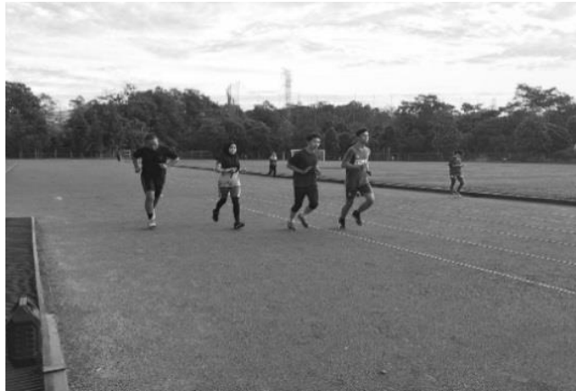
Gambar 1. Pengambilan data Multi-Stage 20-m Shuttle Run Fitness Test

Sampel memulai lari dan berbalik arah mengikuti bunyi audio yang telah disediakan. Skor tes yang dicapai oleh sampel adalah jumlah 20 m yang dilalui selesai sebelum sampel menarik diri secara sukarela dari tes, atau gagal berada dalam jarak 3 m dari garis akhir pada dua kali berturut-turut bunyi audio.