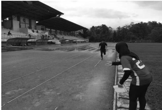
Gambar 2. Pengambilan data 400 Meter Run Test

Sampel memulai lari dan berbalik arah mengikuti bunyi audio yang telah disediakan. Skor tes yang dicapai oleh sampel adalah jumlah 20 m yang dilalui selesai sebelum sampel menarik diri secara sukarela dari tes, atau gagal berada dalam jarak 3 m dari garis akhir pada dua kali berturut-turut bunyi audio.