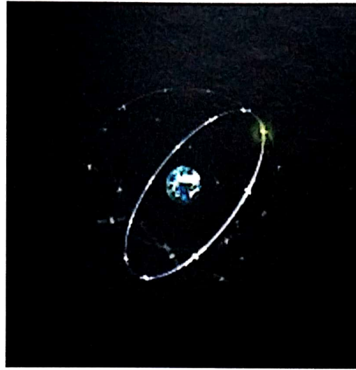
Gambar 2-1: Konstelasi 30 satelit navigasi

Galileo akan memberikan data yang lebih cepat dan akurat hanya dalam radius 1 meter, dibandingkan dengan GPS yang hanya mampu memberikan keakuratan dalam radius 3 meter. Seperti halnya GPS dan GLONASS, Galileo akan memberikan service navigasi ke masyarakat umum untuk digunakan pada telpon mobile (HP, Ponsel) canggih, peralatan-peralatan personal navigasi dan peralatan navigasi lainnya yang membutuhkan data dari satelit. Program satelit Galileo yang terdiri dari konstelasi 30 satelit navigasi yang akan ditempatkan dalam 3 bidang orbit di orbit MEO, sebagaimana dapat dilihat dalam Gambar 2-1 (ESA, 2010).