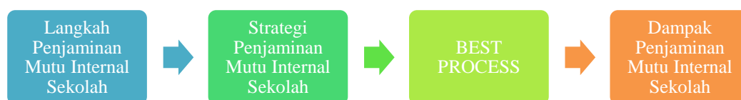
Gambar 1. Prosedur Pelaksanaan Penjaminan Mutu Internal Sekolah

Sulaiman dan Wibowo (2016) menyatakan cita-cita, harapan akan mutu sebuah lulusan membutuhkan sebuah sistem penjaminan mutu agar mutu lulusan dapat ditingkatkan diupayakan berkelanjutan. Mutu sekolah dapat diukur dari seberapa besar para lulusan yang dihasilkan terserap pada sekolah tingkat selanjutnya dan diterima didunia kerja. Sallis (2012) mengungkapkan bahwa produk dikatakan memiliki mutu atau berkualitas apabila memenuhi dua unsur yakni dapat memenuhi keinginan dan harapan pelanggan dan menetapkan spesifikasi yang tinggi. Prosedur pelaksanaan penjaminan mutu internal ditunjukkan Gambar 1.