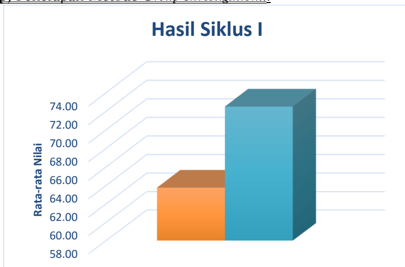
Diagram 1. Hasil Belajar Siklus I

Berdasarkan diagram di atas dapat dilihat terdapat peningkatan hasil belajar kognitif pada siklus I dibandingkan dengan hasil belajar prasiklus. Prasiklus siswa mendapatkan nilai rata-rata 63,76 dimana terjadi peningkatan 8,74 poin menjadi 72,5. Peningkatan cukup baik dari hasil belajar siswa tetapi belum cukup dalam mencapai target ketuntasan klasikal kelas.