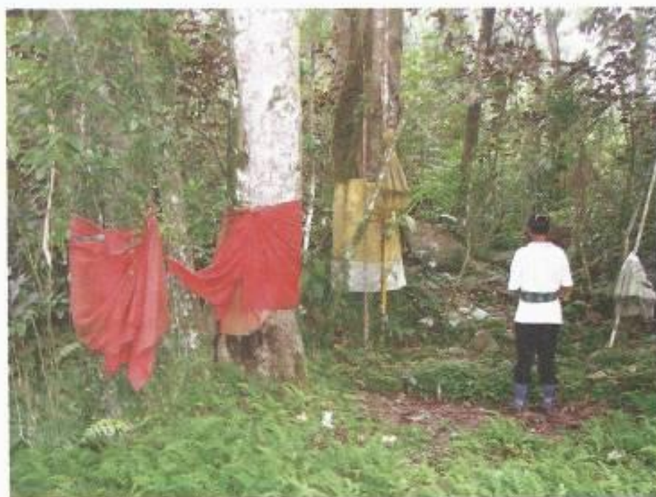
Foto 1. Pohon-pohon besar yang dianggap mempunyai kekuatan gaib (dinamisme/animisme)

bernyawa atau memiliki kekuatan. Sementara itu, kepercayaan animisme menganggap bahwa hutan, tumbuh-tumbuhan atau tempat-tempat tertentu (pohon besar, tempat yang menyeramkan, gua-gua, bukit, gunung, dan lain-lain) ada “ penunggunya ” (makhluk halus). Oleh karena itu, masyarakat tidak secara sembarangan memperlakukan tempat-tempat tersebut. Perlakuan yang kurang baik atau semaunya terhadap benda-benda/obyek tersebut kemungkinan akan menimbulkan mala petaka karena si “ penunggu ” (mahluk halus) akan marah. Oleh karena itu, masyarakat jaman dahulu tidak dapat sembarangan masuk ke luar hutan, membunuh binatang, membabat hutan untuk pertanian, memotong pohon-pohon besar dan lain-lain. Untuk masuk hutan, menebang pohon besar, memasuki gua, dan lain-lain harus memperoleh ijin dari sang penunggu tempat tersebut. Pada saat orang akan beraktivitas yang berhubungan dengan pohon besar, hutan, batu besar, gunung, bukit, dan lain-lain harus minta izin lebih dahulu kepada si penunggu. Untuk itu biasanya diperlukan sarana atau sesaji untuk dihaturkan kepada kekuatan yang menunggu.