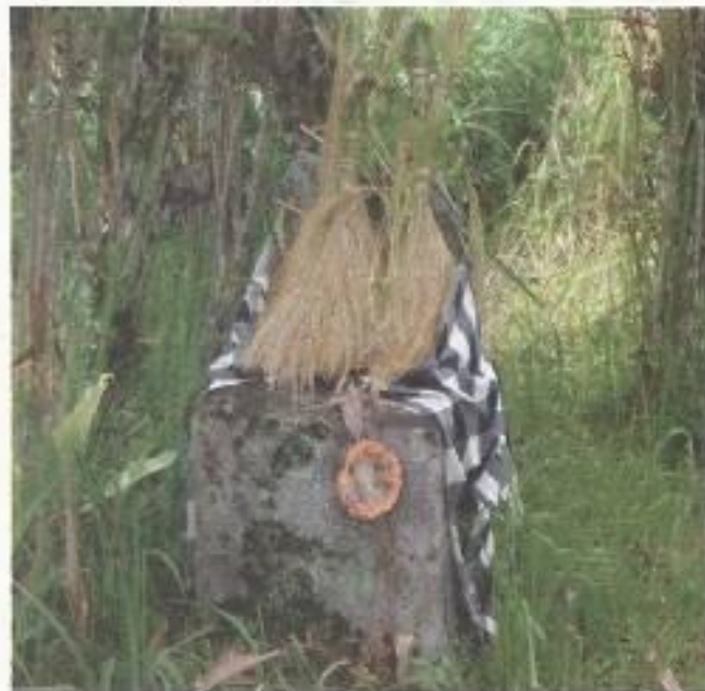
Foto 6. Padi sebagai sarana upacara di atas tahta batu sebagai simbol keberhasilan tanaman

Upacara-upacara yang bersifat sakral yang berhubungan dengan kegiatan pembudidayaan tanaman, tampaknya memegang peranan penting karena mencakup kebutuhan hidup manusia akan kebutuhan makanan. Kegagalan pada bidang pembudidayaan tanaman akan mengakibatkan malapetaka, karena kelaparan akan melanda