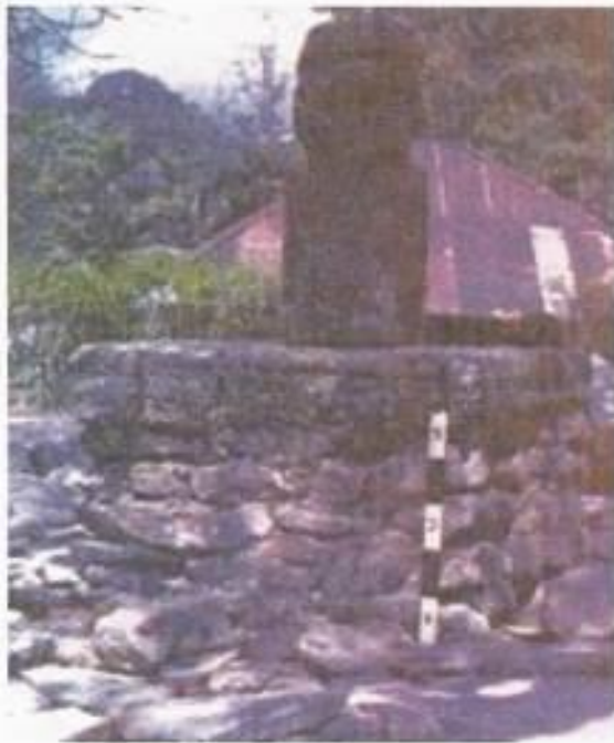
Foto 3. Arca menhir di atas batu temu gelang merupakan medium pemujaan untuk memohon kesuburan tanaman di Desa Kewar, Belu, NTT.

menhir dan katoda (sejenis menhir yang biasanya dibuat dari kayu atau batu) Katoda juga dipergunakan untuk upacara bercocok tanam (Kusumawati, 1985; Suastika, 2006).