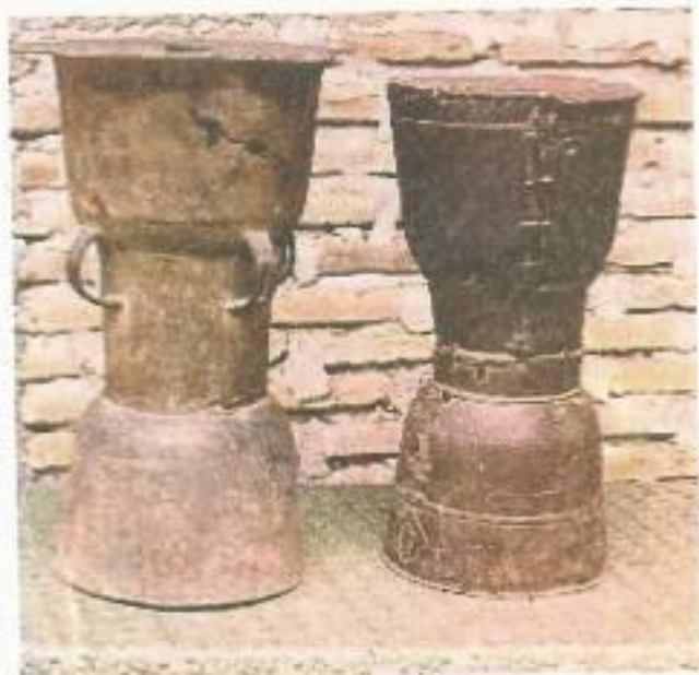
Foto 5. Moko sebagai sarana untuk memanggil hujan di NTT

Seperti telah diuraikan di atas bahwa pada masyarakat megalitik berlanjut di Alor dan Sikka muncul upacara-upacara yang tidak selamanya mempergunakan sarana-sarana bersifat megalit (menhir, arca menhir, dolmen, dan batu datar) dan lain-lain tetapi memanfaatkan benda-benda yang dibuat dari jenis logam, seperti