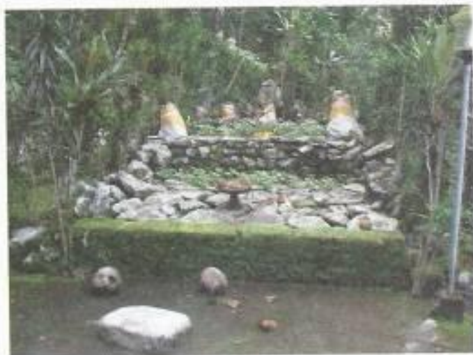
Foto 7. Teras berundak di dalam pura merupakan sarana pemujaan untuk memohon kesuburan tanaman

sebagian dari bangunan-bangunan yang berupa tinggalan arkeologi itu masih tetap digunakan untuk pemujaan bagi masyarakat dalam usaha memohon kesuburan tanaman. Karena fungsinya berhubungan dengan kesuburan tanaman maka tidak mengherankan apabila sarana-sarana pemujaan tersebut ditemukan di sawah, di ladang, kebun dan lain-lain.