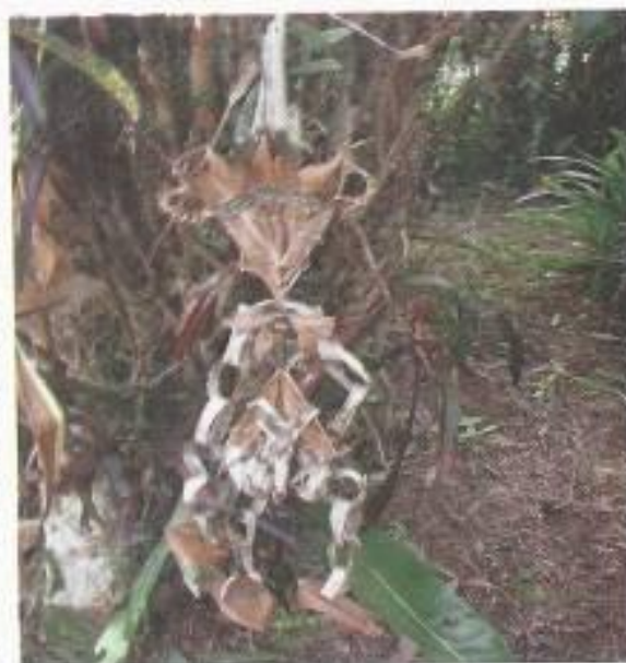
Foto 8. Boneka dari janur simbol atau lambang Dewi Sri

Kelangsungan tradisi penghormatan sebagai rasa bersyukur dan permohonan kesuburan pada yang Maha Kuasa di berbagai tempat di Bali khususnya, dan di berbagai tempat di Indonesia pada umumnya masih terus berlangsung. Adat kepercayaan terhadap Dewi Sri yang dianggap dan diakui sebagai "dewi padi" merupakan salah satu bukti bahwa upacara dalam budidaya tanaman masih terus dipegang. Sampai saat ini masih banyak masyarakat yang mengadakan upacara-upacara kecil pada saat akan menyebarkan benih, pada saat panen maupun pada saat memasukkan padi ke tempat penyimpanan (lumbung). Pada saat penebaran bibit di gunakan sesaji berupa nasi tumpeng, telur ayam, ketupat, dan lain-lain, dan kadang-kadang disertai kendi kecil atau periuk