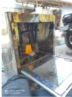
Gambar 5. Pengujian Alat Pencuci Gelas Otomatis