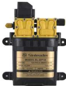
Gambar 1. Pompa Air

Pompa adalah mesin atau peralatan mekanis yang digunakan untuk menaikkan cairan dari dataran rendah kedataran tinggi atau untuk menaikkan tekanan cairan dari cairan bertekanan rendah ke cairan yang bertekanan tinggi dan juga sebagai penguat laju aliran pada suatu sistem jaringan perpindahan.