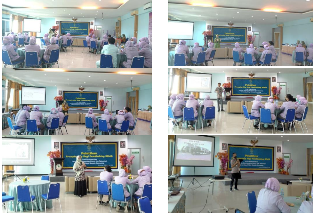
Gambar 2. Foto Kegiatan PKM