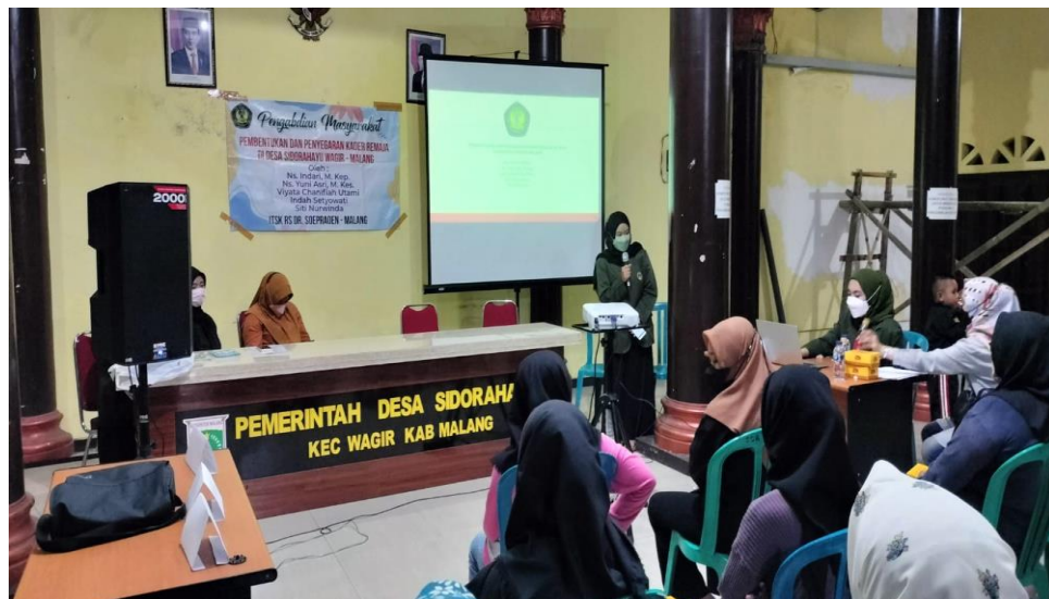
Gambar 3. Pembekalan Materi Tentang Posyandu Remaja

Setelah materi tentang Posyandu Remaja disampaikan pada seluruh kader remaja yang hadir maka dilanjutkan dengan roleplay sesuai dengan perannya masing-masing dengan menerapkan sistem 5 meja yang terdiri dari meja 1 pendaftaran, meja 2 pengukuran (BB, TB, TD, LILA, Lingkar perut), pengecekan anemia, meja 3 pencatatan, meja 4 pelayanan Kesehatan, meja 5 KIE. Para kader remaja dilatih dalam menggunakan alat kesehatan sederhana (tensimeter) dan juga cara pengukuran IMT(Kemenkes, 2018b).