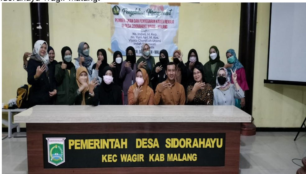
Gambar 2. Pembentukan Kader Remaja di Desa Sidorahayu Wagir Malang.

Selanjutnya pada tanggal 19 Juli 2022 dilakukan tahap lanjutan yaitu pembentukan kader remaja, dalam kegiatan pembentukan Posyandu ini dihadiri oleh 2 Dosen, 3 mahasiswa, 7 remaja, orangtua, kader balita dan lansia, perangkat desa, beberapa petugas kesehatan dari Puskesmas Wagir. Pembentukan kader remaja di pandu oleh tim dosen dari ITSK RS dr Soepraoen Malang dan pendampingan dari pihak Puskesmas Wagir dan perangkat Desa Sidorahayu. hasil kegiatan dalam pembentukan kader remaja ini akan ditetapkan dengan Surat Keputusan dari Kepala Desa Sidorahayu Wagir Malang.