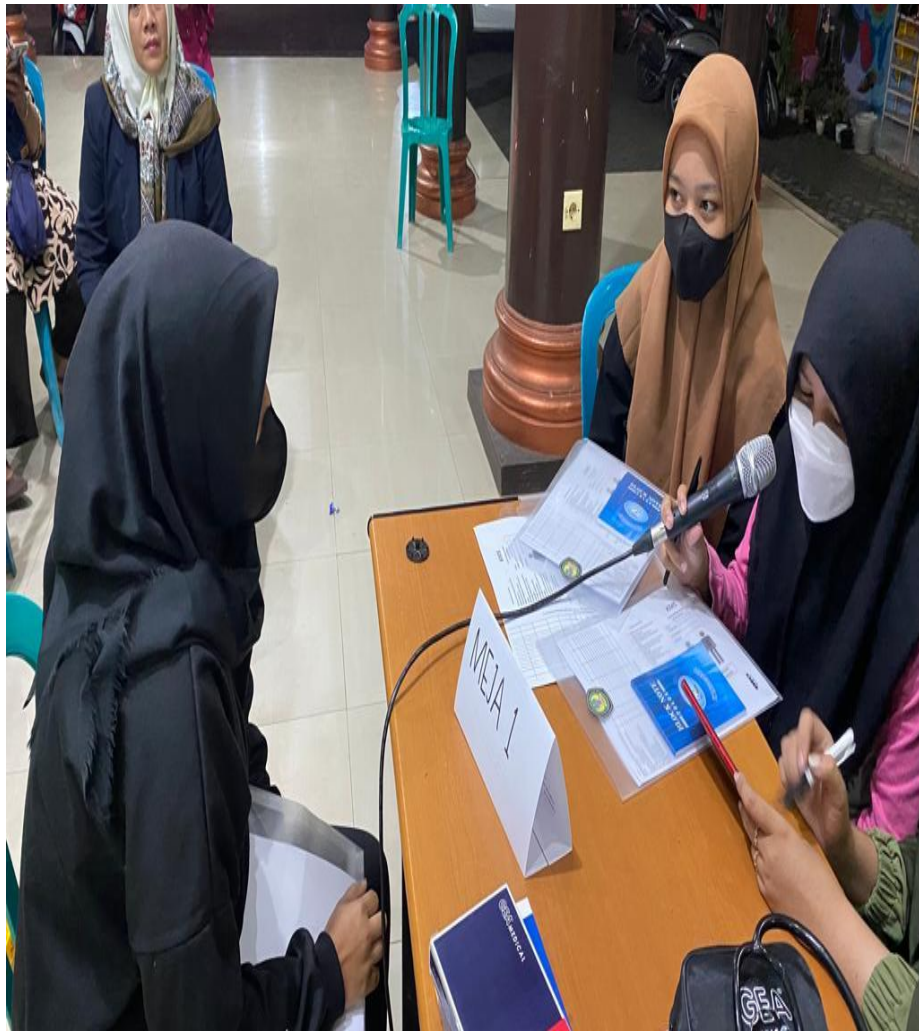
Gambar 4. Role play sistem 5 meja

Hasil dalam kegiatan ini adalah telah terbentuk Posyandu Remaja Desa Sidorahayu Wagir Malang dengan waktu pelaksanaan 1 bulan sekali bertempat di Balai Desa Sidorahayu Wagir Malang.