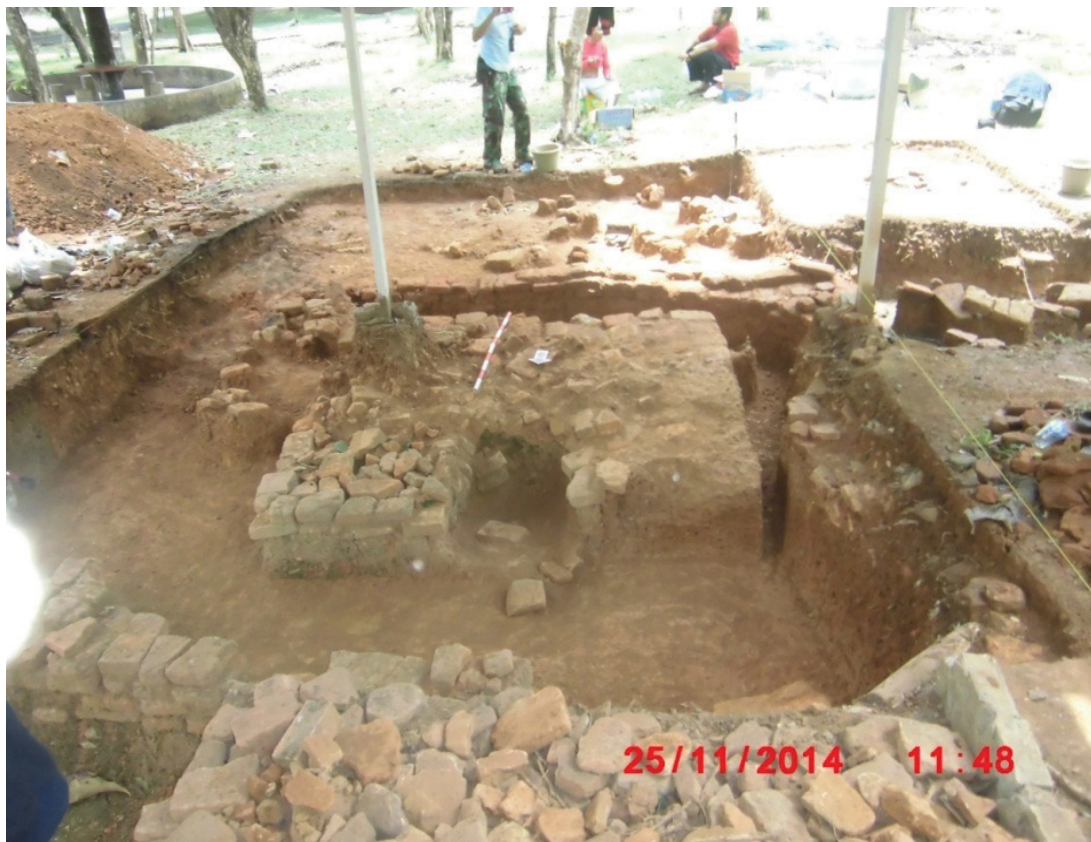
Gambar 4. Struktur bata berdenah segi empat.

Berdasarkan ukuran bata penyusun dapat diketahui adanya tiga jenis bata yang berbeda pada susunan bata pertama sampai ketiga, yakni bata berukuran panjang 27 cm, lebar 15 cm, dan tebal 6 cm. Bata jenis kedua berukuran panjang 37 cm, lebar 15cm, dan tebal 5 cm. Sedangkan bata lainnya berukuran panjang 18 cm, lebar 18 cm, dan tebal 5 cm. Sedangkan pada susunan bata keempat disusun dari dua jenis bata berbeda, yaitu bata berwarna putih dengan ukuran panjang 21 cm, lebar 6 cm, dan tebal 6 cm. Sedangkan ukuran bata berwarna