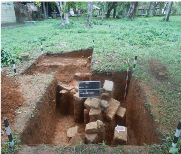
Gambar 5. Struktur bata di puncak Bukit Siguntang.

Selain struktur bangunan di bagian lereng selatan Bukit Siguntang ini, ditemukan juga struktur bata di puncak bukit dengan ukuran bata-bata penyusunnya lebih besar, dibandingkan yang ada di lereng, yaitu 41 cm x 21 x 9 cm. Struktur ini hanya terdiri dari satu lapis bata dengan panjang 81 cm, lebar 41 cm dan tebal 9 cm (gambar 5). Di bawah struktur