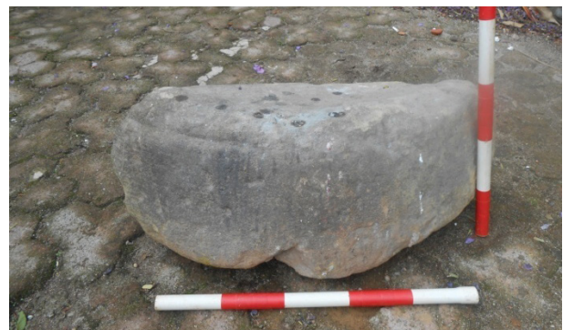
Gambar 6. Fragmen bantalan arca.

Selain sisa-sisa bangunan dari bata, ditemukan juga artefak yang berada di dalam cungkup makam Panglima Bagus Kuning dan Panglima Bagus Karang. Artefak pertama terletak di atas Makam Panglima Bagus Kuning berupa bantalan arca ( asana ) yaitu tempat untuk mendirikan sebuah patung ( padma ) yang berukuran panjang 68 cm, lebar 34 cm dan tinggi 27 cm (gambar 6). Sisi bagian luarnya melingkar, dan sisi dalamnya cenderung rata. Kemungkinan merupakan satu sisi (1/4 bagian) bawah padma untuk mendirikan arca. Berdasarkan informasi yang berhasil dihimpun dari juru kunci makam, dahulunya batu ini merupakan bagian atau menjadi salah satu nisan