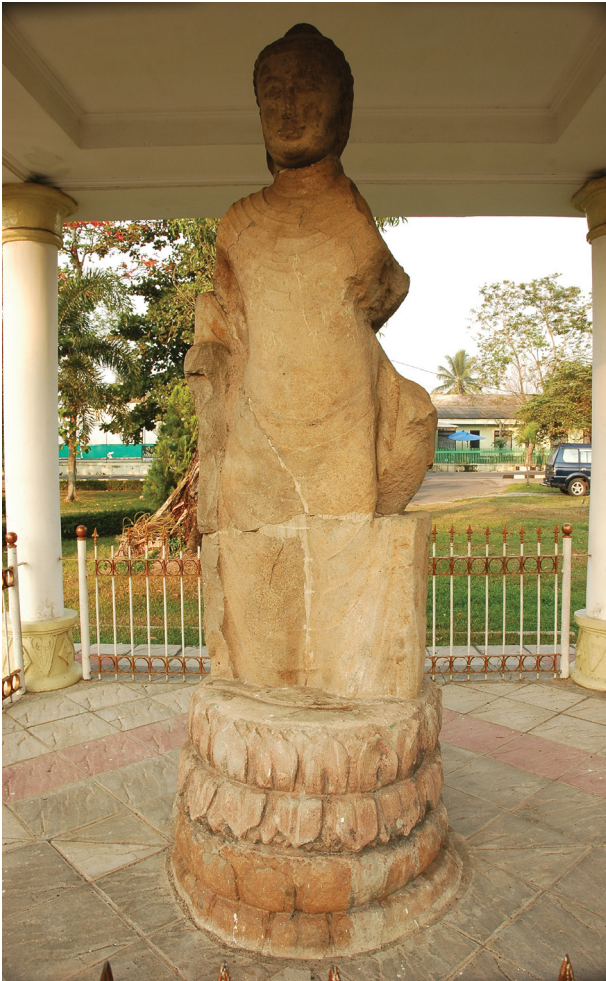
Gambar 3. Arca Buddha dari Situs Bukit Siguntang.

tempat yang berjauhan tetapi masih di daerah Bukit Siguntang. Bagian badannya digambarkan memakai kain dengan lipatan seperti wiru di bagian tengah. Kain yang dikenakannya itu diikat dengan sabuk dari kain yang lebar.