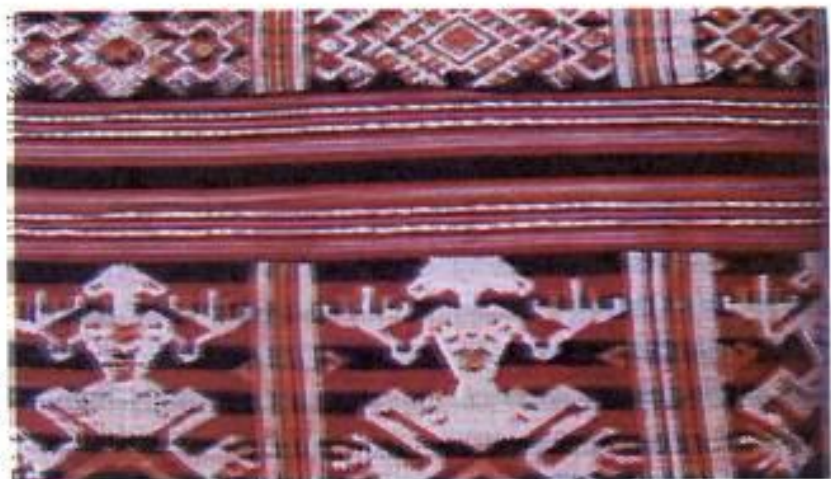
Foto 2. Ragam hias teksturnya agak halus motif burung dan