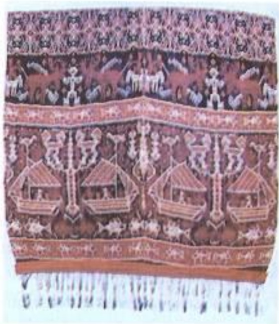
Foto 11. Kain Sumba motif ikan, kuda, ayam dan perahu layar