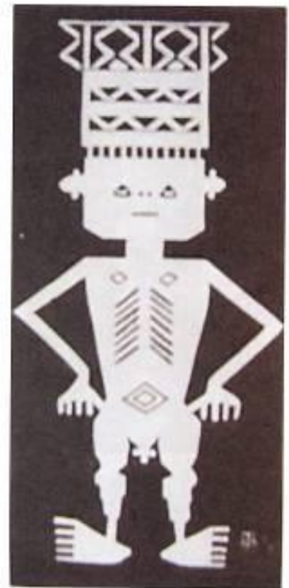
Foto 5. Kain Sumba motif manusia