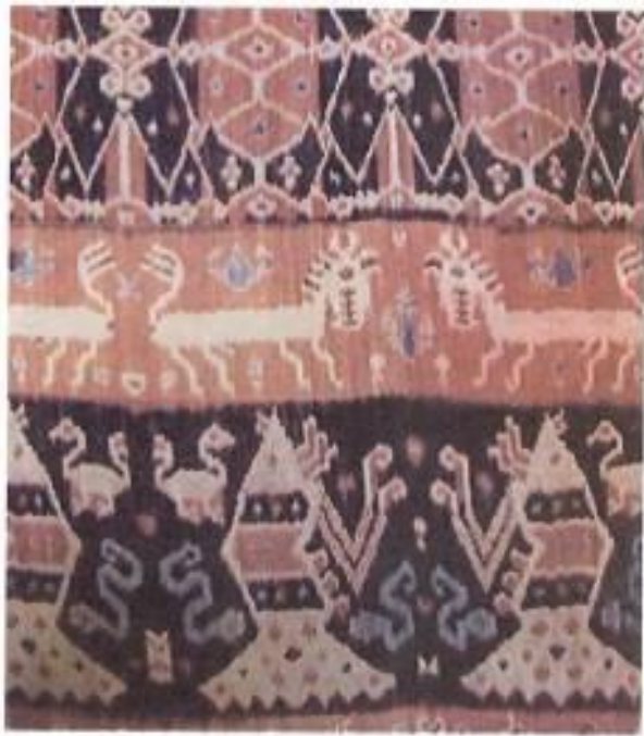
Foto 8. Kain Sumba motif kuda dan udang