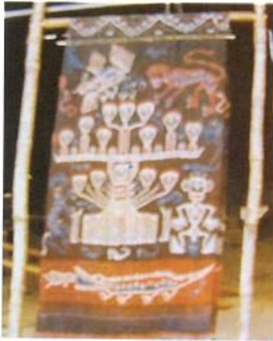
Foto 12. Kain Sumba motif monyet, tumbuh-tumbuhan, manusia dan buaya