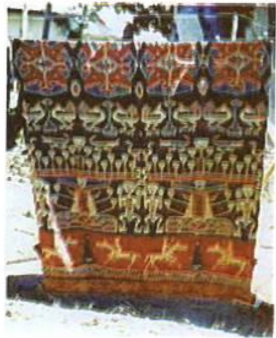
Foto 13. Kain Sumba motif burung, buaya, ayam, udang, manusia dan kuda