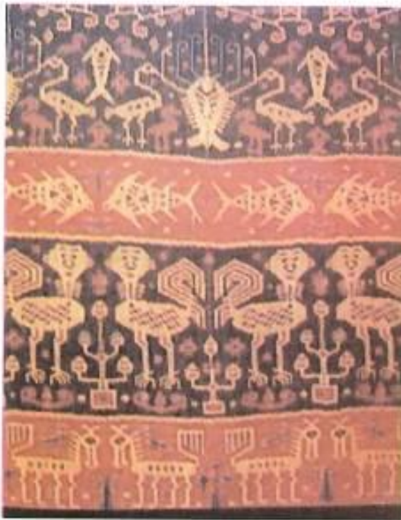
Foto 6. Kain Sumba motif burung, ikan, udang, kuda dan tumbuh-tumbuhan