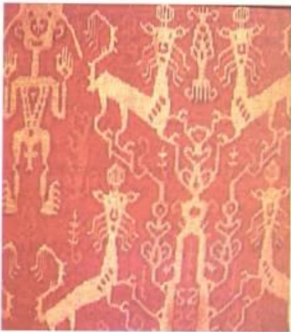
Foto 10. Kain Sumba motif manusia, kijang dan tumbuh-tumbuhan