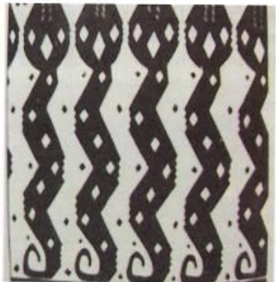
Foto 7. Kain Sumba motif ular