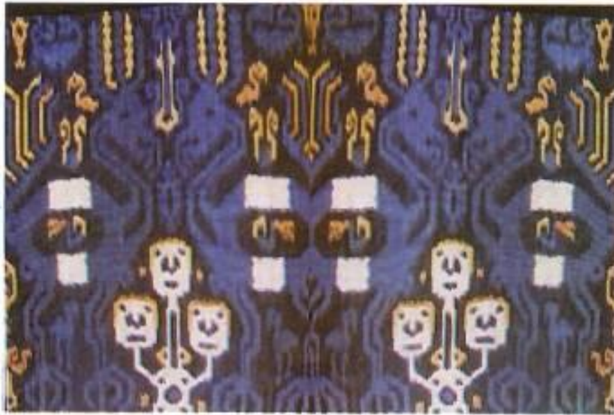
Foto 3. Benang lungsi yang sudah diberi motif kodok

Bentuk-bentuk hiasan yang dominan adalah bentuk binatang, manusia, pohon, perahu dan pola geometris yang baik secara lepas maupun dirangkai. Pola hias ini dibuat berulang, baik secara vertical maupun horizontal dengan suatu susunan dalam satu bidang. Bentuk-bentuk ragam hias tersebut antara lain : manusia kangkang; binatang yaitu kuda, kijang, gajah, anjing, ayam, burung, buaya, biawak (cecak), ular, kura-kura, udang, ikan; pohon-pohonan; alat angkut laut yaitu perahu dan pola geometris yang dirangkai dan ada beberapa perkembangan belakangan. Binatang ini pada awalnya mendekati bentuk realis dan dalam perkembangannya banyak yang sudah disterilisasi sesuai kekuatan imajinasi seniman pembuatnya. Material yang dipakaipun tidak lagi menggunakan benang pintalan sendiri, pewarna alami, tetapi sudah menggunakan produk toko (sintetis). Kain-kain yang menggunakan material seperti ini pada umumnya memiliki warna yang lebih banyak, bentuk ragam hias yang tidak terlalu menonjol, karena tekstur kain yang berbeda. Kain-kain semacam ini secara ekonomi, sasaran konsumennya adalah masyarakat kelas bawah sedangkan kain-kain yang memakai benang toko tetapi warnanya tetap tradisional alami, yang menjadi sasarannya adalah orang-orang kaya, orang-orang asing yang datang di Sumba dan toko-toko kesenian.