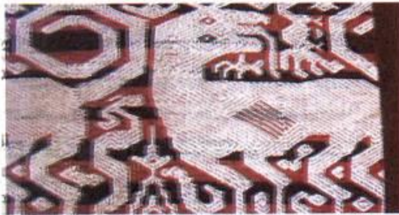
Foto 1. Ragam hias yang teksturnya kasar, motif binatang

Pembentukan ragam hias didukung oleh tekstur kain yang menambah kesan unik dari kain tersebut. Ragam hias dibentuk pada benang "lungsir" dengan cara mencelup benang yang telah diikat terlebih dahulu dengan bahan yang tidak tembus pewarna, sesuai pola hias yang diinginkan kedalam pewarna tradisional. Dalam pewarnaan ini dapat dilakukan berulang kali sesuai macam warna yang diinginkan. Warna-warna tradisional dibuat dari akar pohon dan daun yang diolah secara tradisional pula. Olahan inipun memerlukan waktu yang relative panjang sehingga mendapatkan nilai tambah dari kain tersebut baik secara ekonomis maupun secara kualitas. Warna putih, merah tua, merah muda, biru tua, biru muda dan kadang-kadang warna hitam yang terjadi dari campuran warna merah dan biru. Tekstur pada ragam hias kain Sumba terjadi karena ikatan benang "pakan" dengan benang "lungsir" yang sudah memiliki motif. Tekstur terkadang kasar dan terkadang lebih halus (foto 1, 2, dan 3).