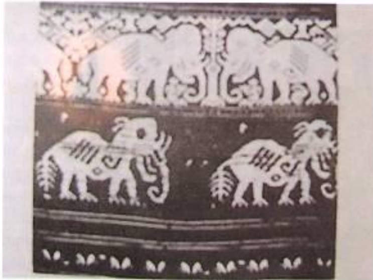
Foto 4. Kain Sumba motif gajah