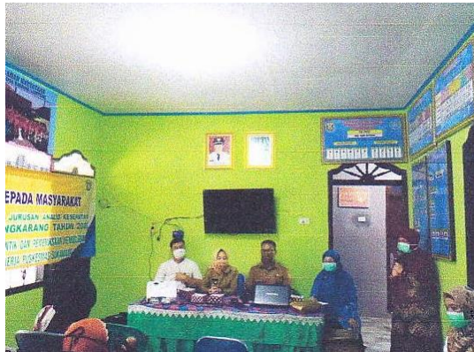
Gambar 1. Kegiatan edukasi tentang pengetahuan malaria

dan penyuluhan tentang pemeriksaan dan pengendalian kadar hemoglobin darah terhadap kadar agar dapat mengendalikan dan memantau kadar hb malaria.