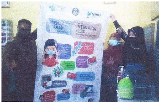
Gambar 2. Kegiatan pemasangan bener dan stiker tentang covid-19

Kegiatan selanjutnya adalah pengabdian kepada masyarakat dengan kegiatan pemasangan bener dan stiker tentang covid-19. Hal ini dilakukan di kantor kelurahan keteguhan dan di beberapa tempat di kelurahan keteguhan dengan tujuan untuk memberikan edukasi kepada masyarakat agar dapat melakukan pencegahan penyebaran, penularan penyakit akibat infeksi covid-19 secara mandiri.