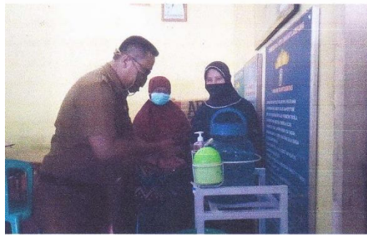
Gambar 3. Pemberian alat cuci tangan