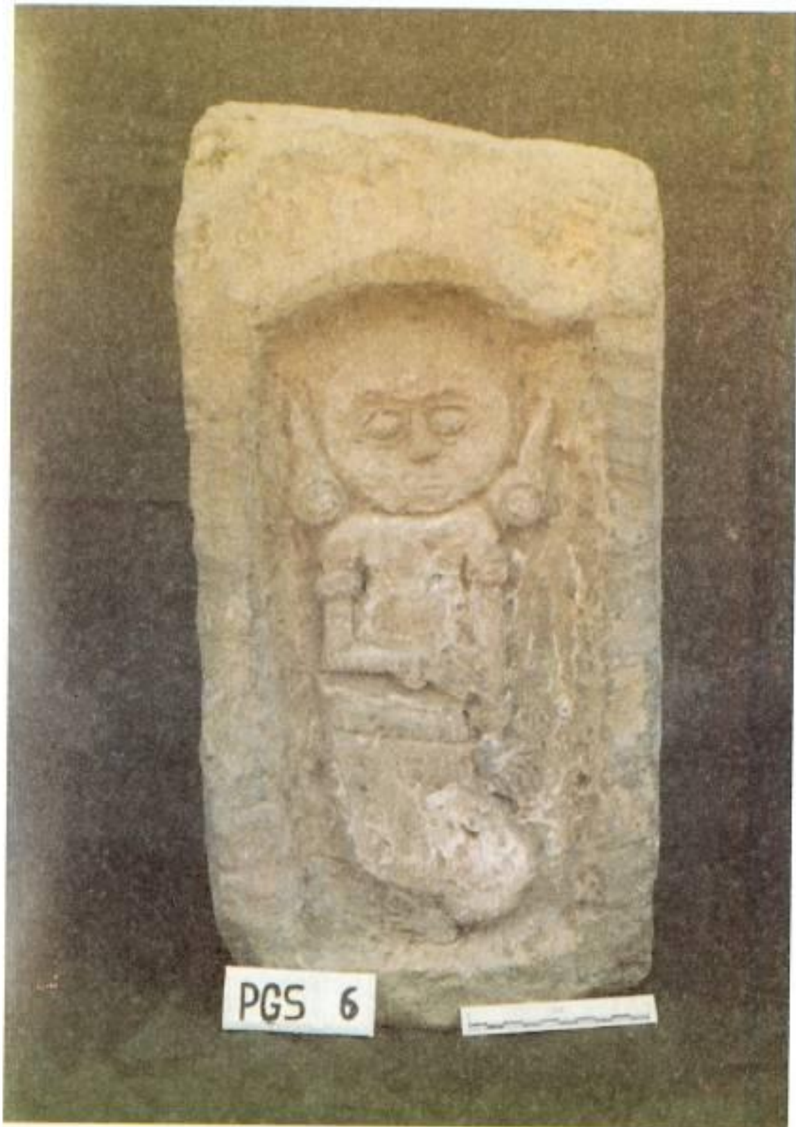
Relief Cili di Pura Gunung Sekar.