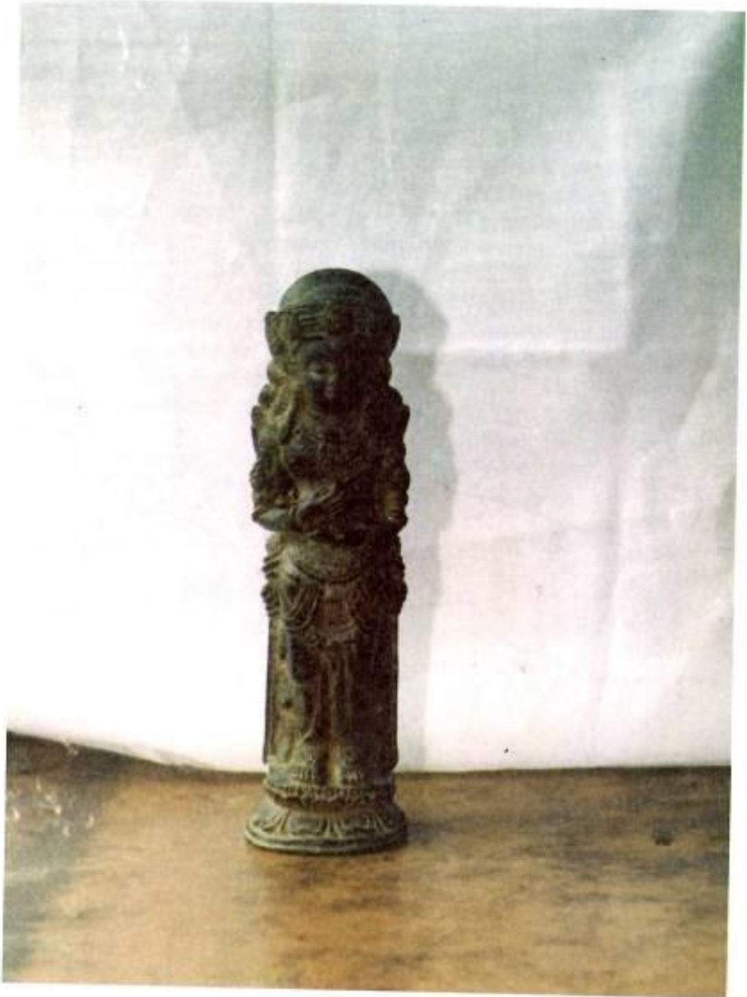
Arca perunggu di Pura Buitan, Dusun Siut, Desa Tulikup, Gianyar.