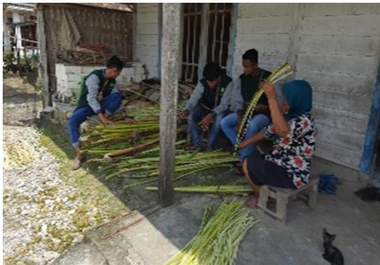
Persiapan bahan kerajinan pohon pisang