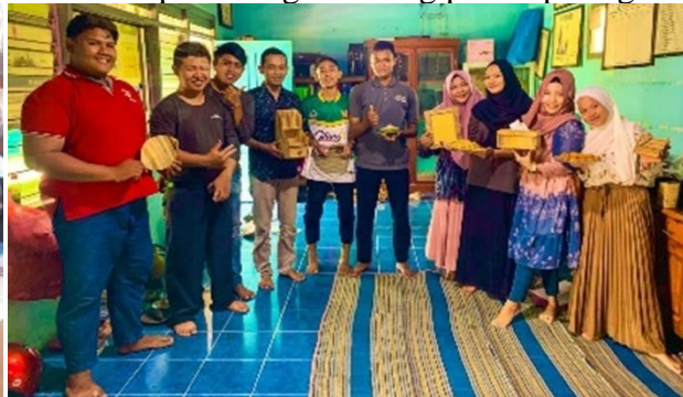
Penyerahan hasil kerajinan kepada warga