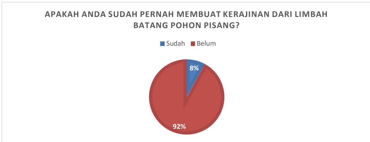
Gambar 1. Hasil Instrumen Kepuasan Peserta Pertanyaan No 1

Pada tahap akhir disebarakan instrumen angket kepuasan peserta untuk mengetahui kepuasan masyarakat terhadap keseluruhan kegiatan serta mengukur tingkat keberhasilan dari kegiatan ini. Pertanyaan dalam instrumen penelitian ini diambil dari beberapa literatur pengabdian kepada masyarakat (Fathoni et al., 2021; Nihayah et al., 2021, 2022). Hasil instrumen kepuasan oleh peserta ditunjukkan oleh diagram-diagram pada Gambar 1-4.