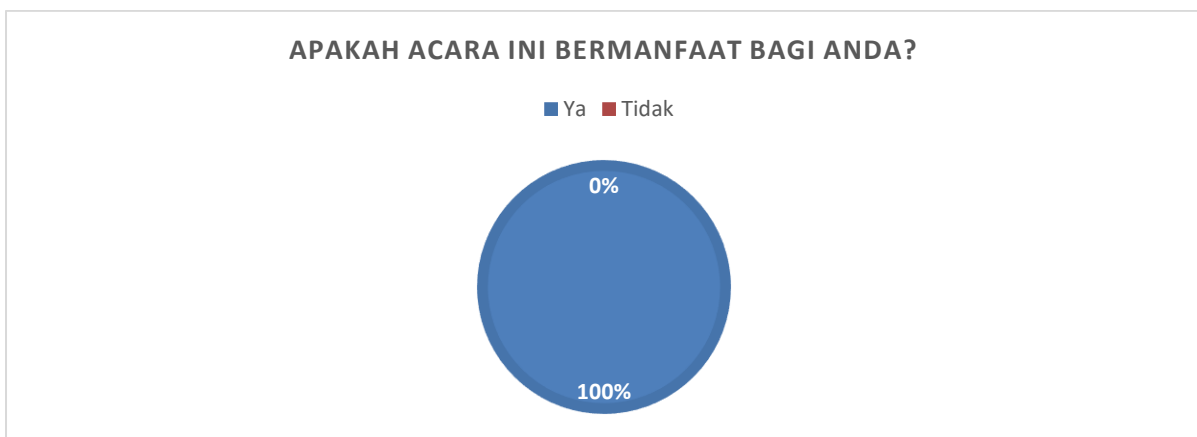
Gambar 2. Hasil Instrumen Kepuasan Peserta Pertanyaan No 2