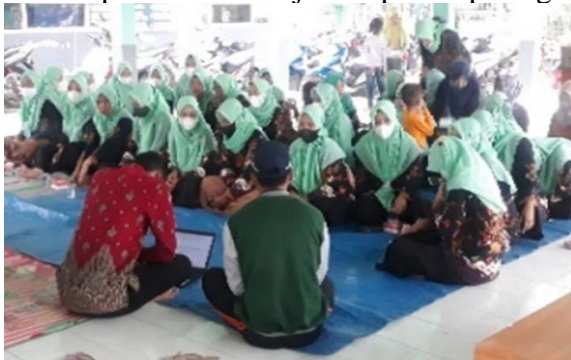
Kegiatan penyuluhan dan pelatihan