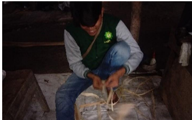
Proses pemotongan batang pohon pisang