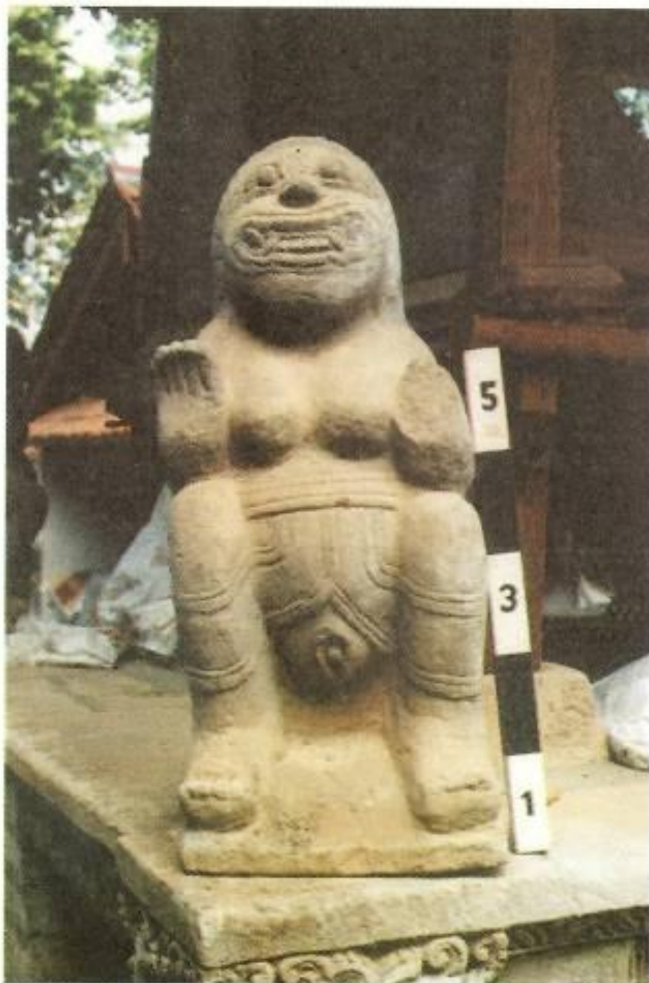
Foto No. 1. Arca No. 3, dengan menonjolkan alat kelamin.