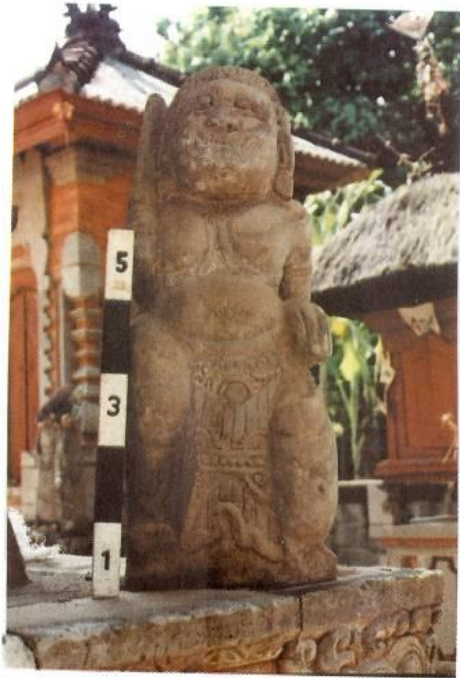
Foto No. 3 Arca dengan hiasan kain