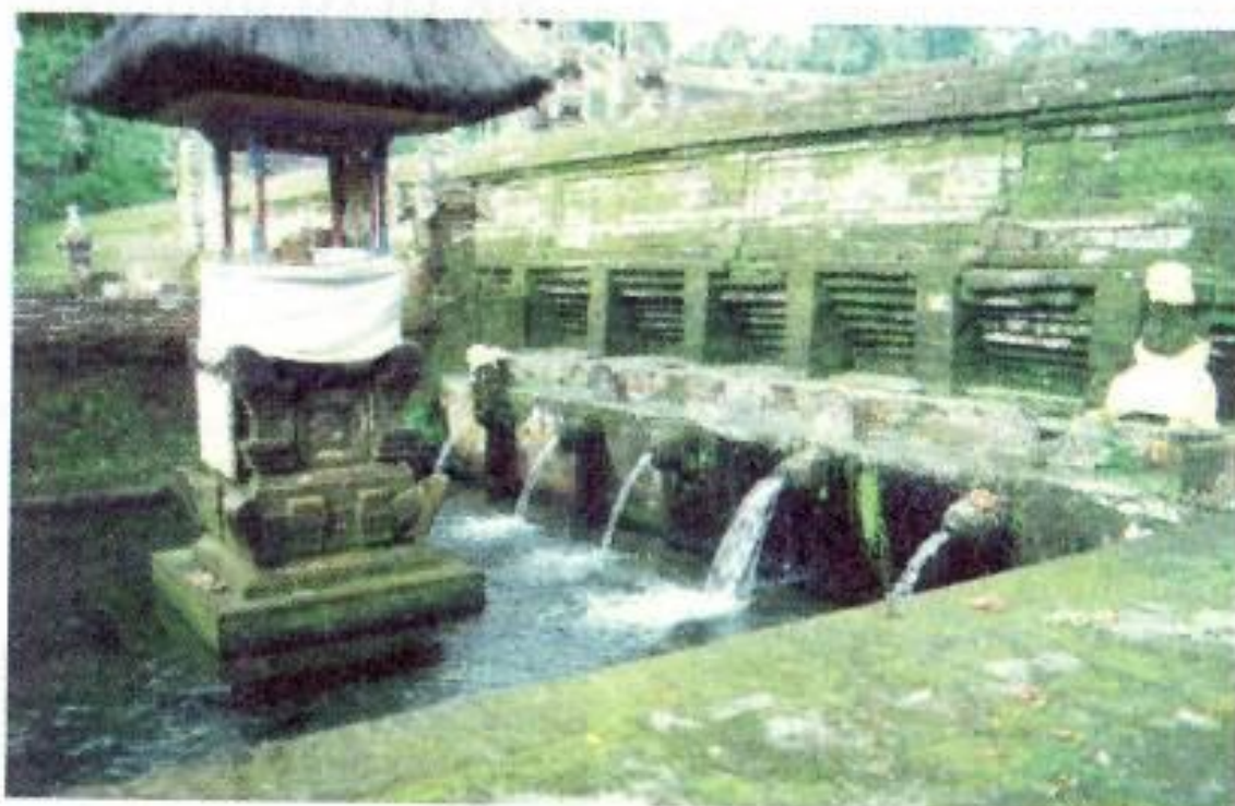
Petirthaan Pacaka Tirha, Pura Tirtha Empul, Kecamatan, Tampak siring, Kabupaten Gianyar.