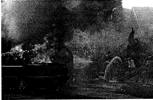
Gambar 1 Kerusuhan Mojokerto

Hingga saat ini, 103 orang massa pendukung Gus Dim masih ditahan dan diperiksa polisi. 28