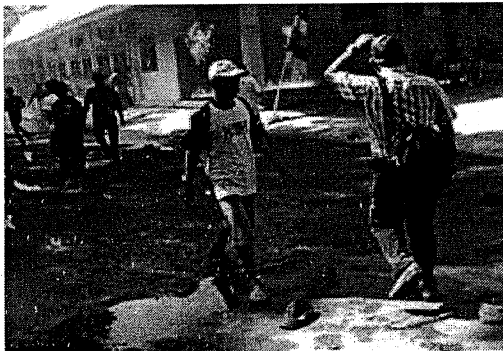
Gambar 2 Kerusuhan Mojokerto