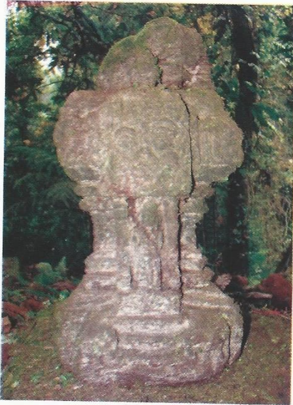
Foto no. 2. Miniatur di Pura Biji Munduk Sangkur, Candi Kuning Baturiti, Tabanan

(foto no. 2) namun miniatur Candi Blancan tidak memiliki hiasan seperti tersebut.