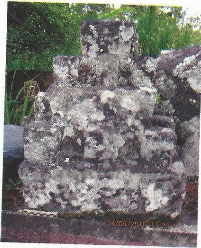
Foto No. 1. Miniatur Candi di Pura Puseh Blancan, Kintamani, Bangli

miniatur candi hanya berbentuk segi empat. Dengan melihat bentuk atau struktur Candi Blancan tersebut dapat dianggap sebagai suatu bangunan candi yang sangat sederhana, karena tidak adanya hiasan relung, pelipit, relief, dan tanpa bilik (gambar No. 1). Kendatipun demikian bangunan tersebut tetap memiliki nilai estetis dan nilai relegius.