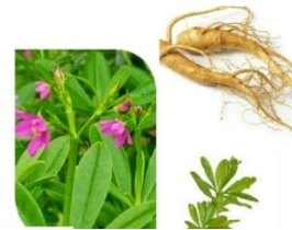
Gambar 1. Ginseng Jawa ( Talinum paniculatum Gaertn.)

Ginseng Jawa ( Talinum paniculatum Gaertn.) diketahui memiliki banyak kandungan kimia seperti saponin, antioksidan, peptida, polisakarida, alkaloid dan poliasetilen (Lina dkk., 2015). Ginsenoside merupakan salah satu kandungan saponin jenis triterpenoid yang juga terkandung dalam ginseng jawa (Yachya dan Manuhara, 2015). Ginsenoside diketahui berperan penting dalam merangsang pertumbuhan pada rambut (Santi dan Jaya, 2020).