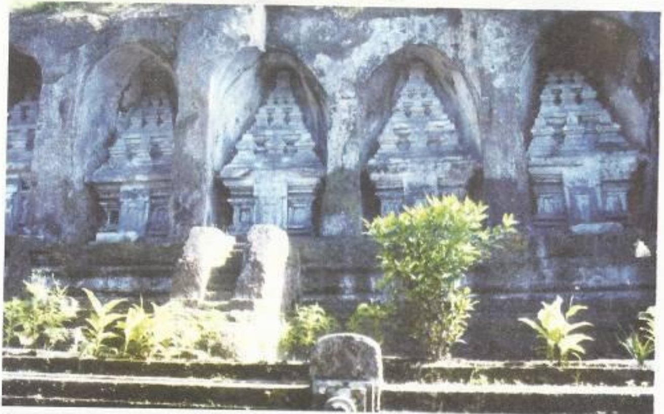
Candi Gunung Kawi, Tampaksiring, Gianyar