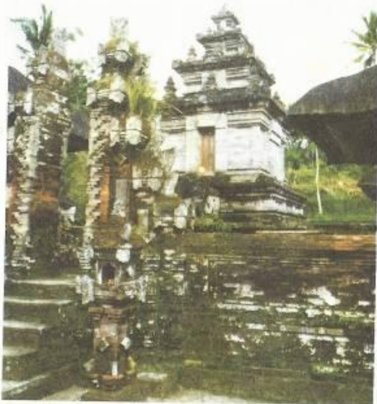
Candi Mengening, Tampaksiring, Gianyar