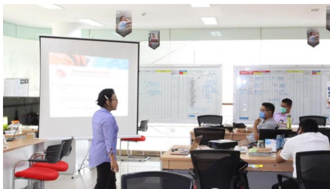
Gambar 2. Suasana Kegiatan Pengabdian

kebutuhan primer dan sekunder. Customer diberikan pemahaman tentang pentingnya dana darurat yaitu besaran dana darurat yang harus tersedia dimasa yang sulit akibat terjadinya pemutusan hubungan kerja yaitu idealnya 3-6 bulan pengeluaran bulanan, jika kurang dari 3 bulan maka dianggap kurang ideal dan untuk faktor keamanan maka besaran dana darurat yang paling aman yaitu 1 tahun pengeluaran bulanan. Hal-hal yang harus diperhatikan dalam menentukan dana darurat adalah jenis pekerjaan atau usaha, umur, status perkawinan, dan jumlah anak yang dimiliki serta usia anak apakah dalam masa pendidikan.