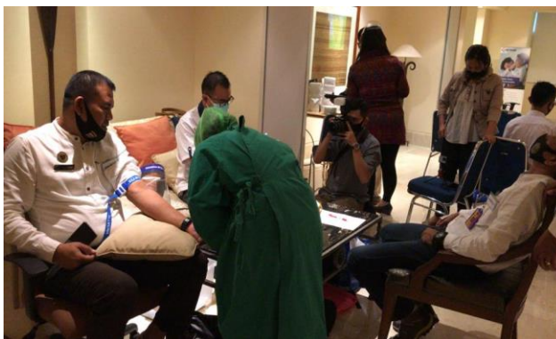
Gambar 4. Rapid Test Peserta Sebelum Kegiatan (Kerja Sama Dengan RS. Bethsaida)