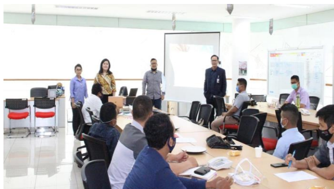
Gambar 1. Pemberian Materi Terkait Pengelolaan Keuangan

Cuplikan video selama 15 menit begitu menarik minat peserta sebagai awal pembukaan sebelum masuk dalam materi awal. Materi berikutnya yang diberikan yaitu penjelasan tentang apa itu cashflow management atau aliran uang masuk dan keluar serta bagaimana mengelolanya. Dijelaskan bahwa cashflow management merupakan hubungan antara penghasilan yang diterima pengeluaran yang dilakukan juga investasi atau tabungan. Kunci pengelolaan cashflow management yaitu total pengeluaran yang dikeluarkan tidak melebihi pemasukan yang diterima (Marocco, 2020).