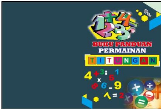
Gambar 8. Desain Cover Bagian Luar Buku Panduan Permainan.

permainan yang dapat dilihat pada Gambar 8 dan Gambar 9.