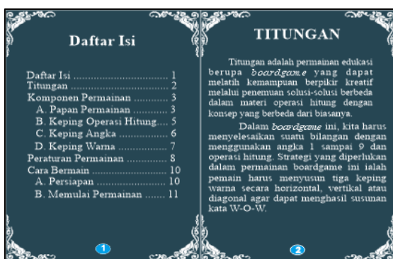
Gambar 9. Desain Isi Bagian Dalam Buku Panduan Permainan.