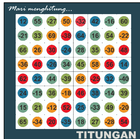
Gambar 2. Desain Bagian Depan Papan Permainan seri II.