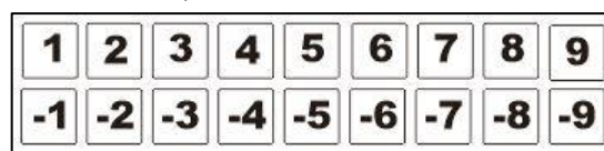
Gambar 5. Desain Keping Angka.

desain keping angka yang dapat dilihat pada Gambar 5.