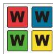
Gambar 6. Desain Keping Warna Bagian Depan.

d) Desain Keping Warna; Desain keping warna ini dibuat menggunakan aplikasi Corel Draw yang terdiri atas 4 warna dengan masing-masing warna memiliki huruf W pada bagian depan dan huruf O pada bagian belakang. Keping warna berbentuk persegi yang akan digunakan untuk menandai daerah dari hasil operasi bilangan yang sudah ditentukan oleh pemain. Berikut desain keping warna yang dapat dilihat pada Gambar 6 dan Gambar 7.