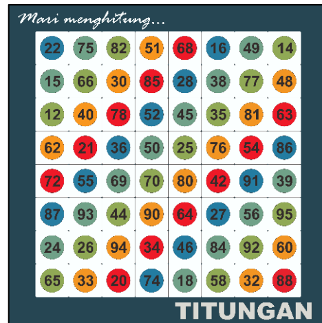
Gambar 1. Desain Bagian Depan Papan Permainan seri I.

Berikut desain papan permainan yang dapat dilihat pada Gambar 1, Gambar 2 dan Gambar 3.