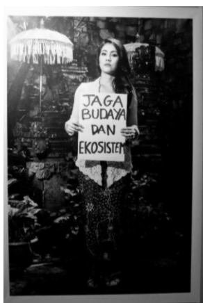
Gbr 1. Referensi Karya Foto

Sebelum melakukan pemotretan penulis menghubungi narasumber dan menentukan jadwal pemotretan serta menjelaskan konsep foto yang dibuat kepada narasumber. Kemudian pada tahap pemotretan, penulis lebih banyak fokus untuk menentukan bagaimana sudut pandang yang akan diambil dan teknik apa yang akan dimanfaatkan dalam pemotretan baik dari segi eksplorasi alat fotografi maupun komposisi. Setelah semua direncanakan dengan baik, barulah pemotretan dilaksanakan dengan 2 macam hasil akhir, yang pertama pemotretan narasumber memegang sebuah kertas dengan kata motivasinya yang disajikan dalam warna black white dan kedua adalah pemotretan mengenai pekerjaan yang dilakukan oleh narasumber disabilitas aktif tersebut. Teknik kolase foto yaitu kumpulan dari beberapa foto yang dirangkai menjadi sebuah objek kesatuan dari foto yang digunakan, akan diterapkan pada foto pekerjaan dari narasumber untuk memperjelas alur fotonya.