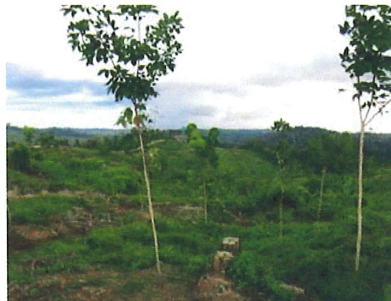
Gambar 5 Tanaman Karet yang sudah berusia 1.5 tahun di areal HTI. Sudah ditanam seluas 546 hektar mulai tahun 2011 sampai April 2013