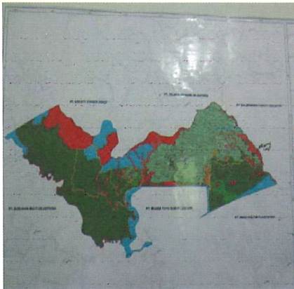
Gambar 1 Map Areal HTI Perusahaan FSS seluas 61.470 hektar