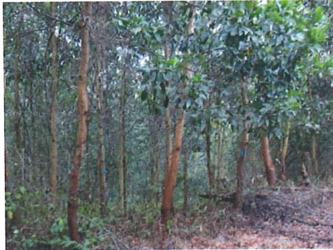
Gambar 3 Tanaman Pokok (HTI) Acacia mangium yang sudah ditanam oleh Perusahaan FSS.

Realisasi tanam dalam Rencana Kerja Tahunan (RKT) 2010-2013, sampai April 2013, sudah ditanam 16.679 ha. Tanaman itu terdiri 14.853 tanaman pokok (Acacia) (Gambar 3); tanaman kehidupan (karet) 500 ha di Kecamatan Long Kali, Kabupaten Tana Paser dan 89 ha di Kabupaten Paser Utara.