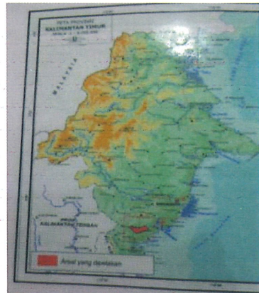
Gambar 2 Dalam kotak merah kecil Areal HTI Perusahaan Fajar Surya Swadaya terletak di Kabupaten Tana Paser dan Kabupaten Paser Utara-Kalimantan Timur