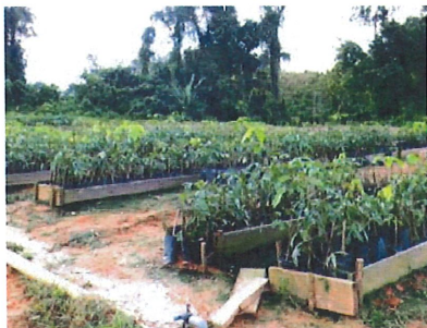
Gambar 4 Bibit Karet jenis PB 260 yang berusia 2 minggu di Pusat Pembibitan Perusahaan

Masyarakat lokal (Muara Toyu) sebagai peserta kemitraan ( partnership ) mendapat fee hasil dari tanaman karet) (Gambar 5).