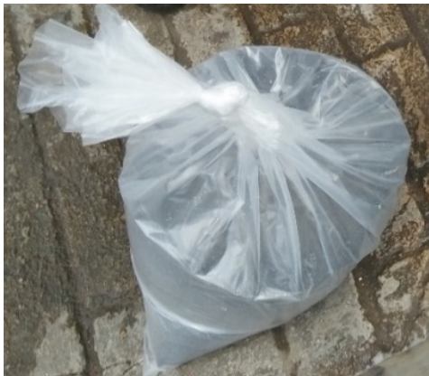
Gambar 2. Sampel Fly Ash PLTU Sanggau

Sampel fly ash batubara yang digunakan pada penelitian ini berasal hasil dari sisa pembakaran mesin Pembangkit Listrik Tenaga Uap (PLTU) Sanggau yang terletak di Sungai Batu Kabupaten Sanggau. Pengambilan sampel dilakukan pada hari Rabu 4 juli 2018 tepatnya di outlet pembuangan fly ash dan bottom ash yang ada di PLTU Sanggau. Jumlah total sampel abu batubara yang diambil ialah sebanyak 29,8 kg. Sampel fly ash PLTU Sanggau dapat dilihat pada Gambar 2 .