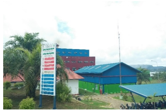
Gambar 1. Lokasi PLTU Sungai Batu, Kabupaten Sanggau

Lokasi pengambilan sampel limbah abu terbang ( fly ash ) batubara berada di Sungai Batu, Kabupaten Sanggau, Provinsi Kalimantan Barat. Gambaran lokasi pengambilan sampel dapat dilihat pada Gambar 1 .