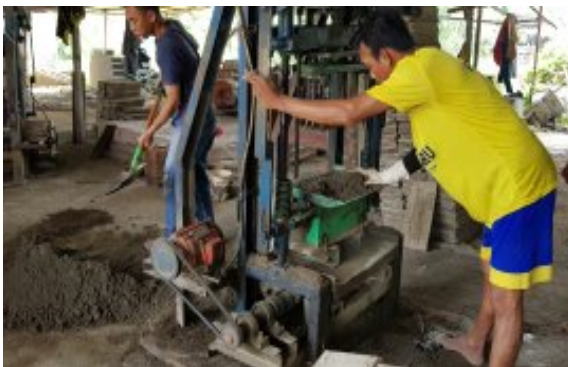
Gambar 3. Proses Percetakan Batako Press

Produk yang dihasilkan sama seperti batako pada umumnya, yang membedakan ialah hanya pada campurannya. Sedangkan proses pembuatan, pengeringan dan uji kuat tekan tetap sama. Proses pembuatan batako dapat dilihat pada Gambar 3 .